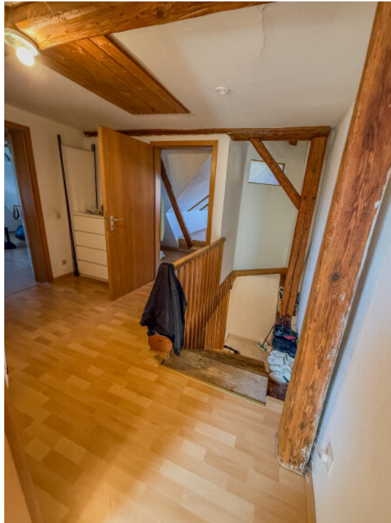
Flur OG 2