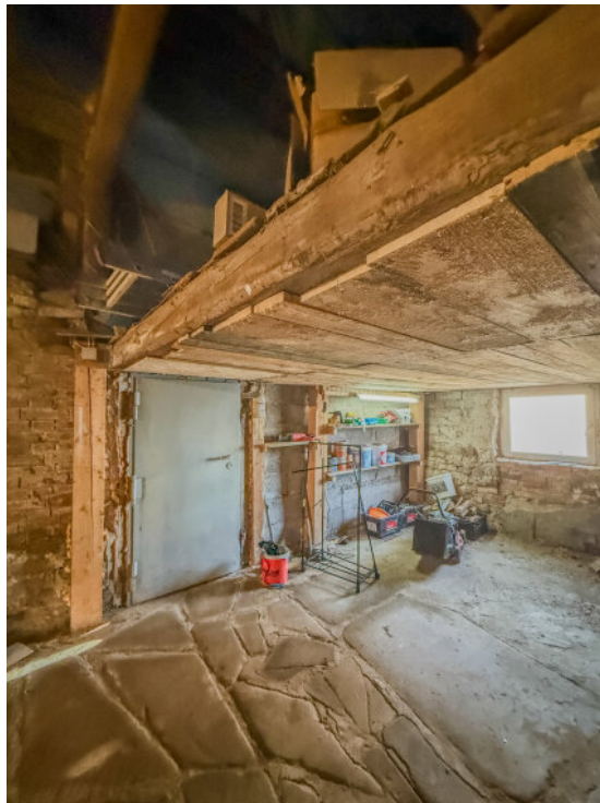
Durchgang Scheune / Wohnhaus