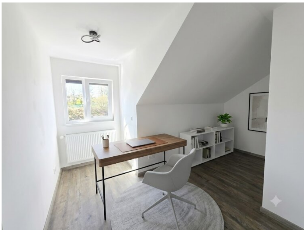
Büro-DG - Virtuell eingerichtet