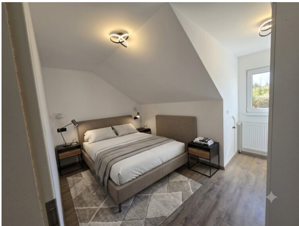
Schlafzimmer-DG - Virtuell eingerichtet