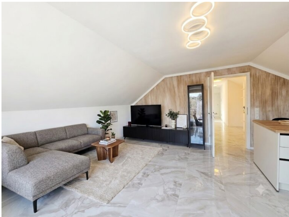
Wohnzimmer-DG - Virtuall eingerichtet