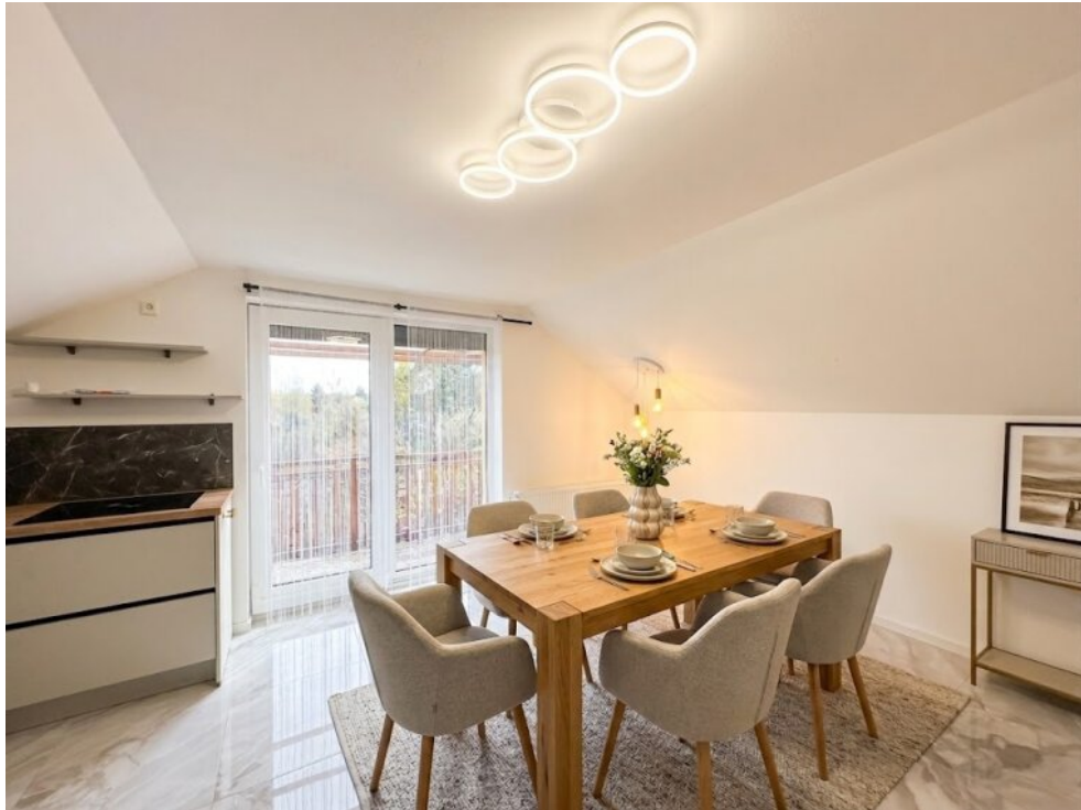
Essbereich-DG - Virtuall eingerichtet