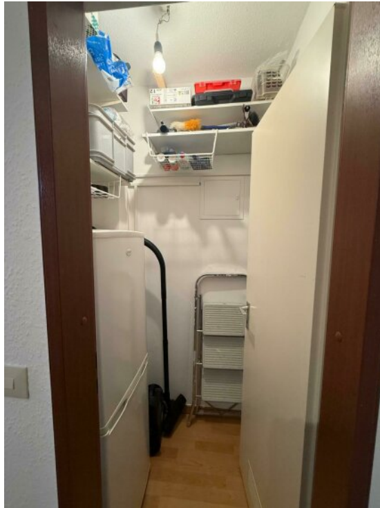
Abstellkammer mit Kühlschrank