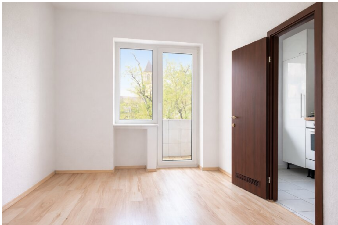
Esszimmer mit Balkon/ Küche