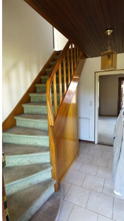
Aufgang zum OG