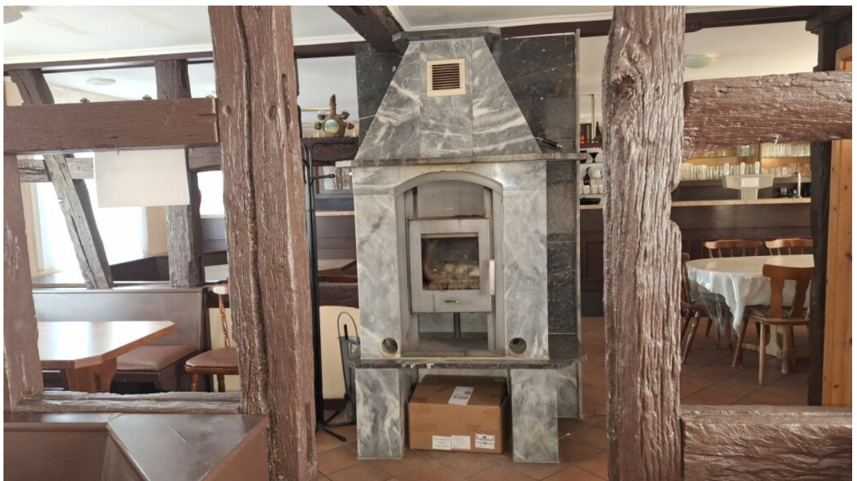
gemütlicher Kamin Gaststätte