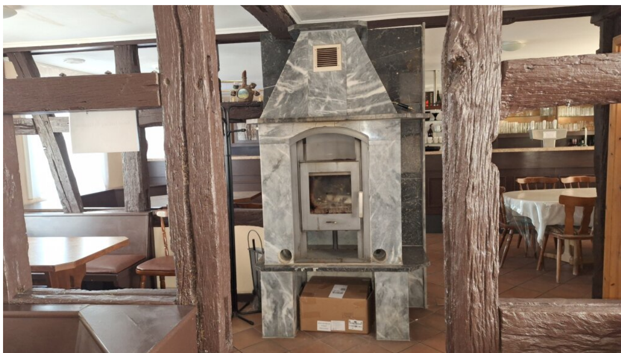
gemütlicher Kamin Gaststätte