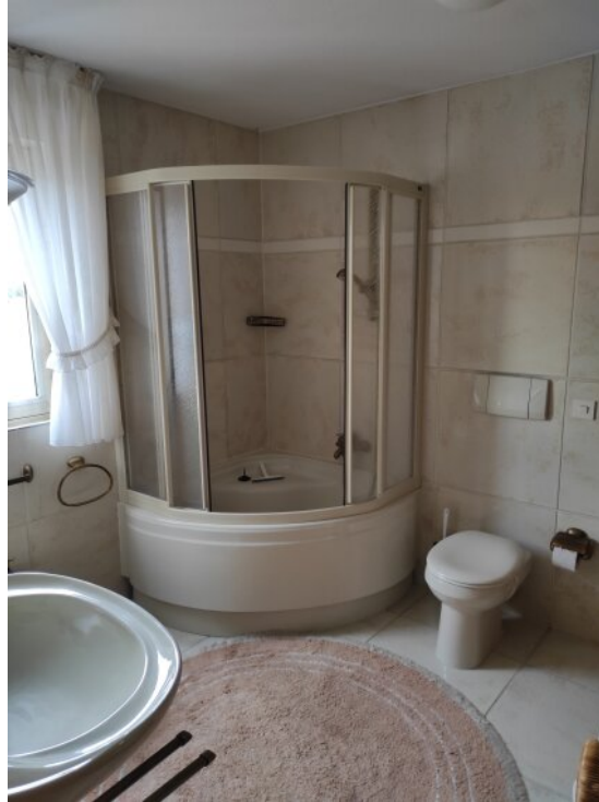
Badezimmer 2 Dusche