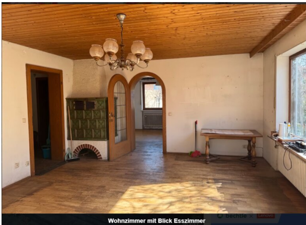
Wohnzimmer mit Blick Esszimmer