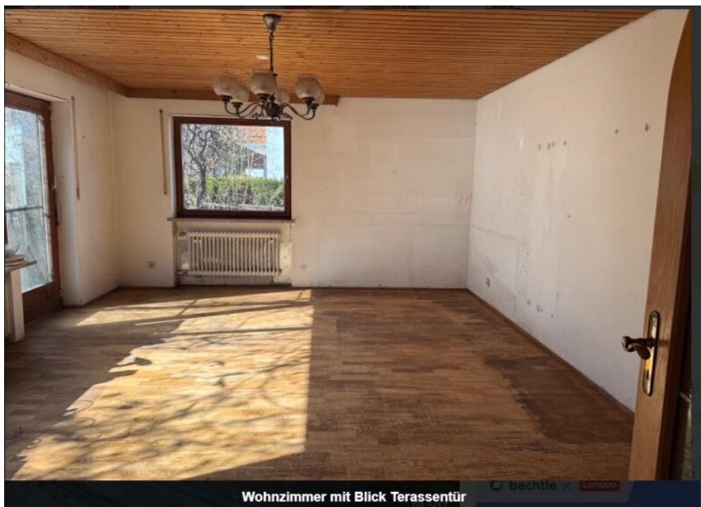
Wohnzimmer mit Blick Terrassentür