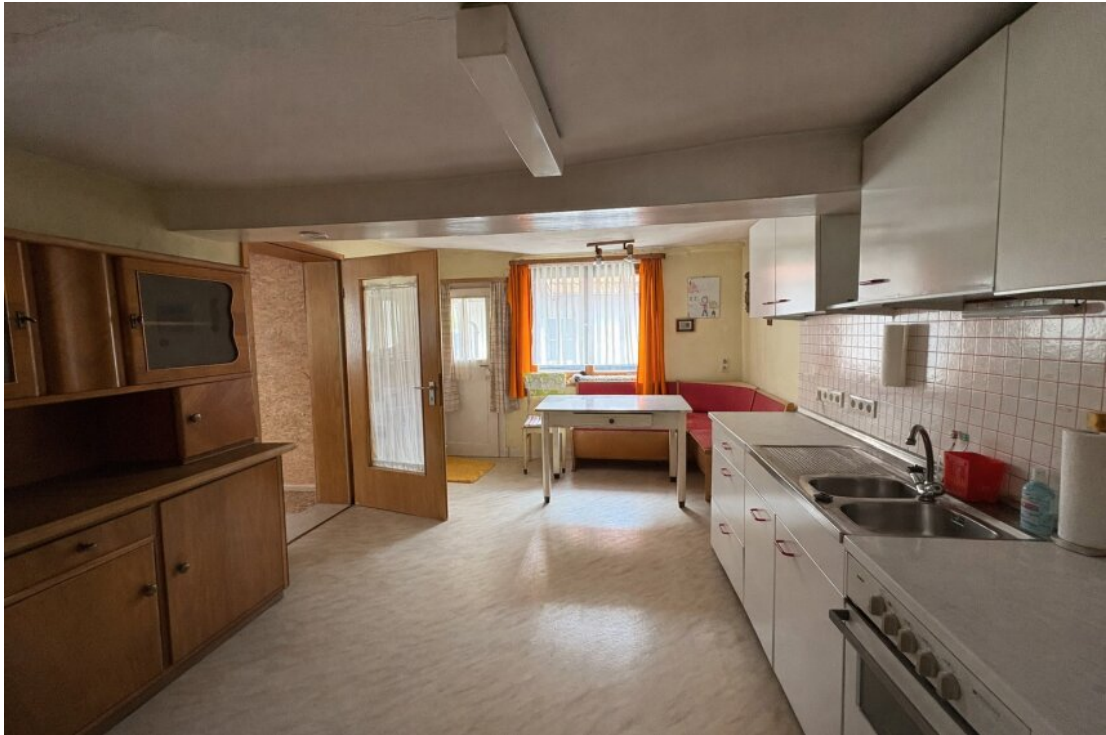
Küche OG mit Zugang zum Balkon