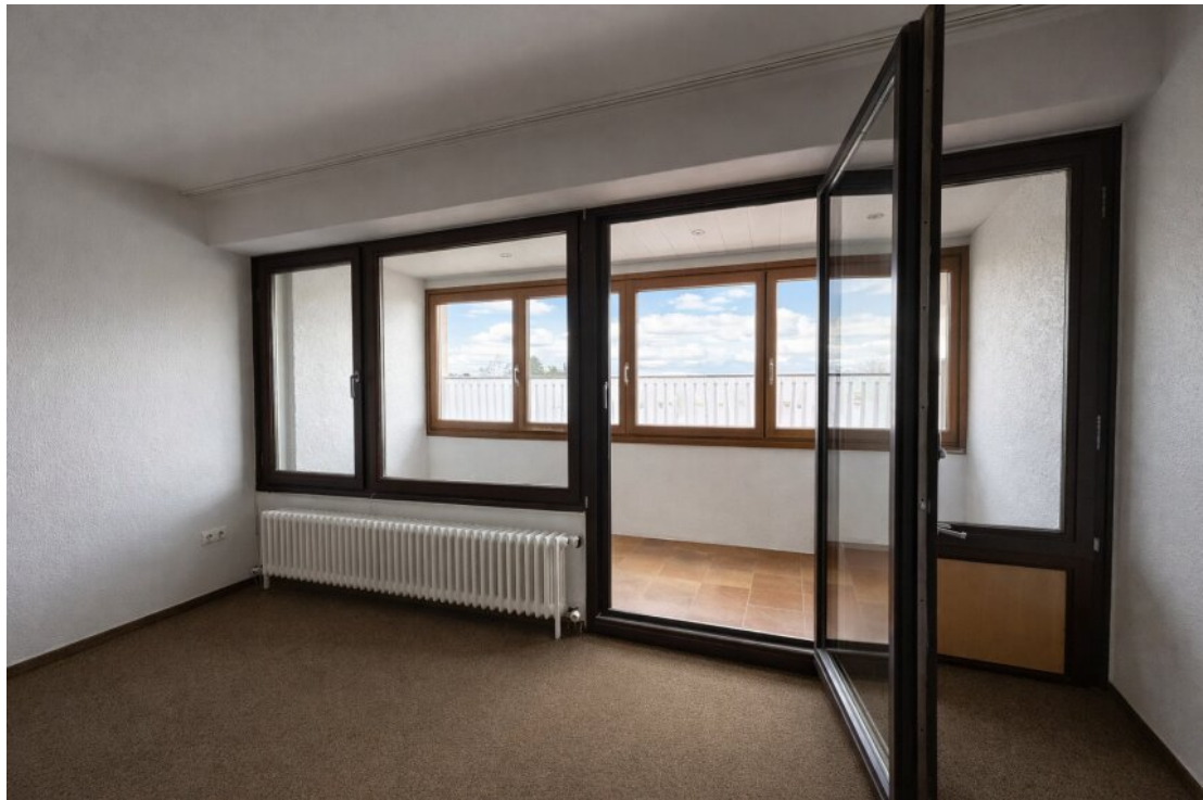
wie ein kleiner Wintergarten