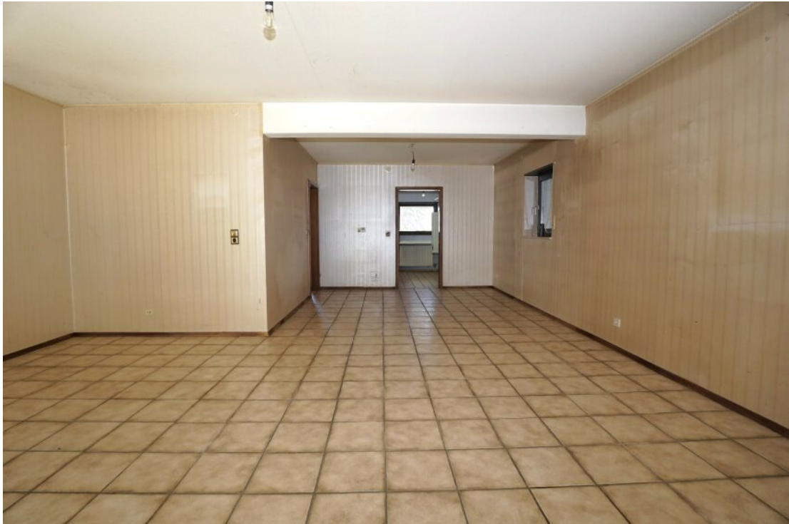
EG Wohn Esszimmer