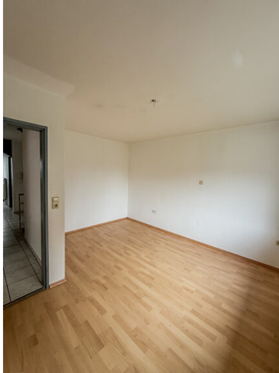
Schlafzimmer im EG