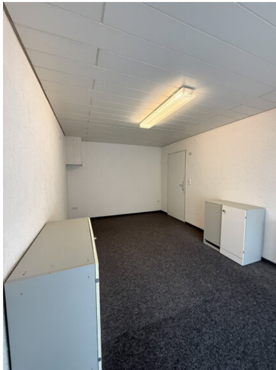
Ladenraum mit Extra Eingang