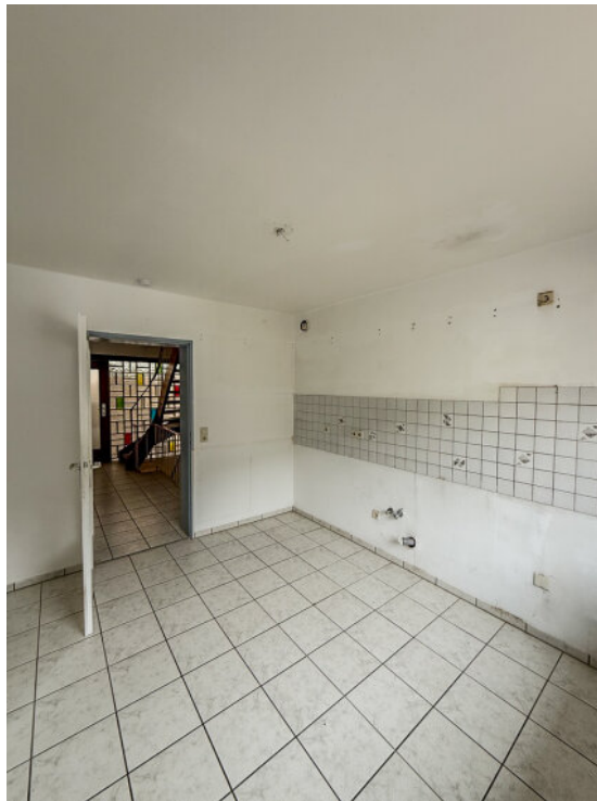
Küche im EG