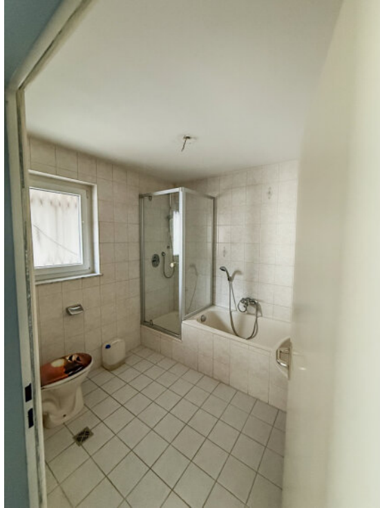
Badezimmer im EG