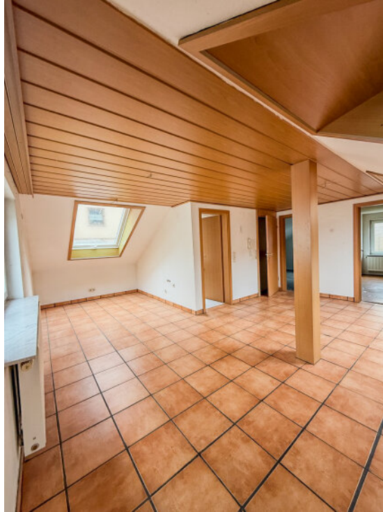
Wohnbereich im DG