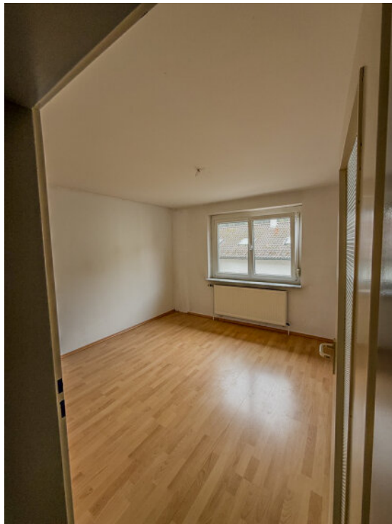
Wohnzimmer im EG