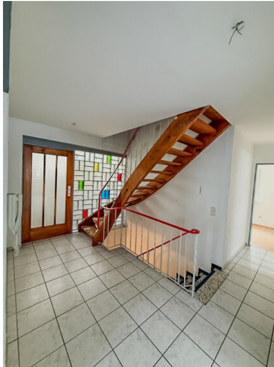
Flur im EG