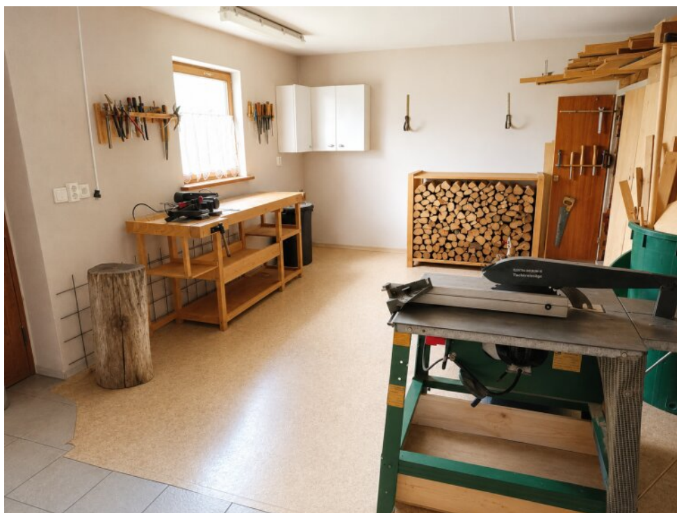
Werkstatt Zugang außen/innen