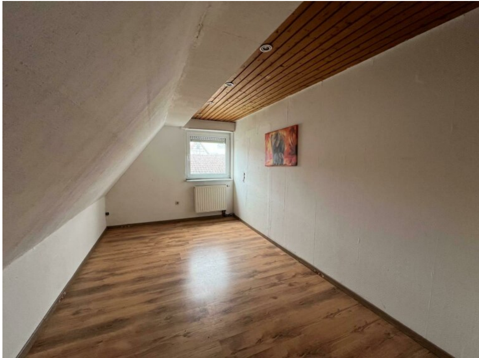
OG Schlafen Nr. 2