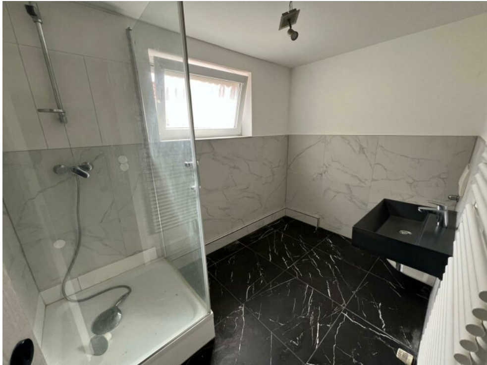
EG Bad Nr. 2