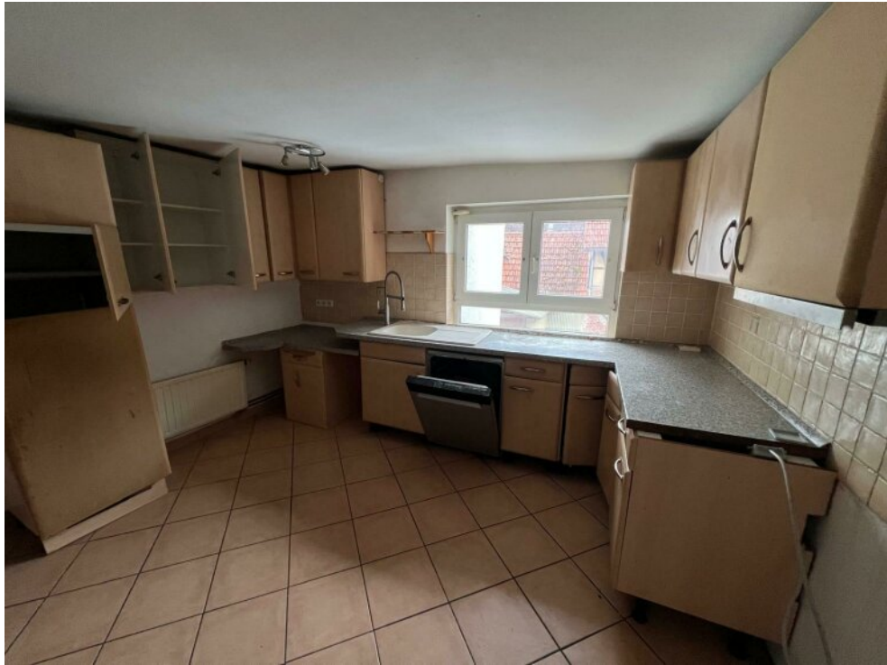
EG Küche Nr. 1