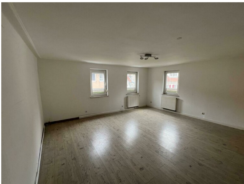
EG Schlafen Nr. 1