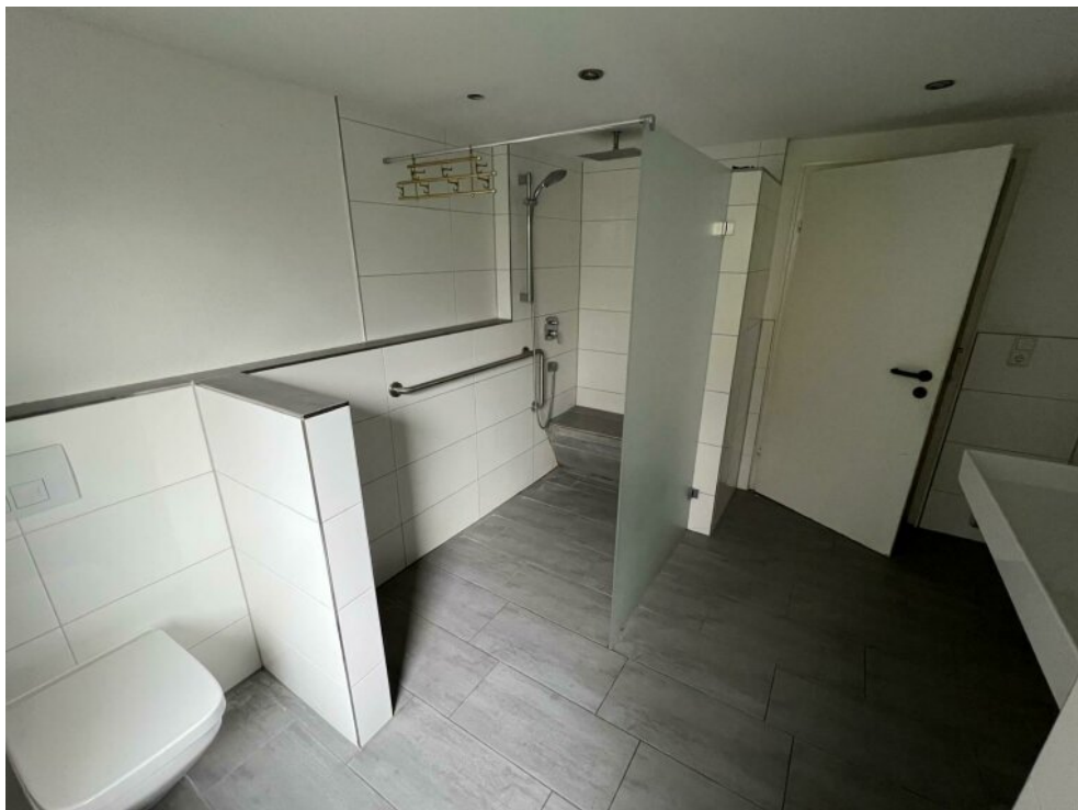
EG Bad Nr. 1