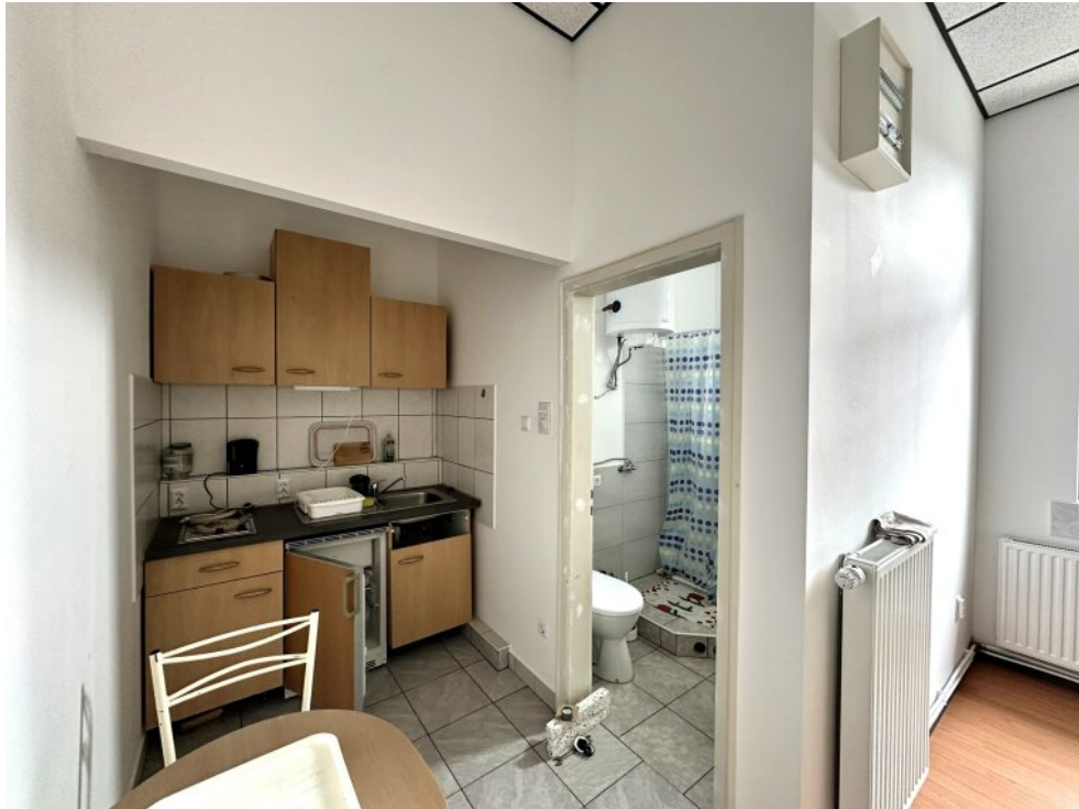
Appartements - Umbau