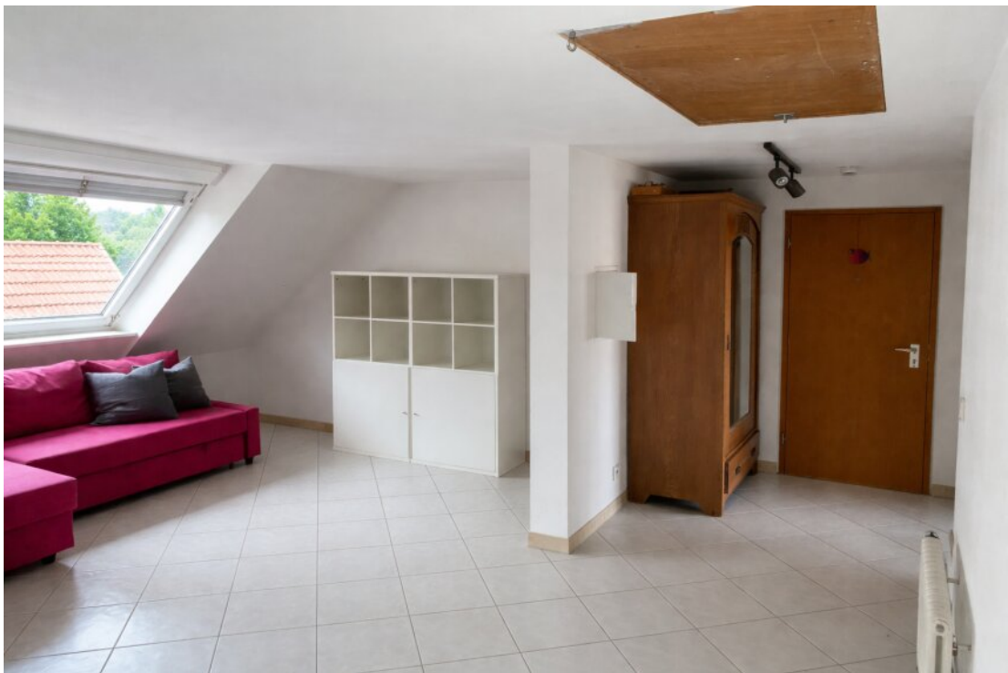
Flur mit Wohnbereich