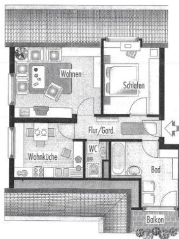
DEIZISAU 2 1/2-Zimmer-Eigentumswohnung

Die Maßangaben sind nicht maßstäblich, die Flächenwerte sind, wenn nicht anders angegeben in Quadratmetern angegeben, die Abkürzung stellt nur einen Vorschlag dar.