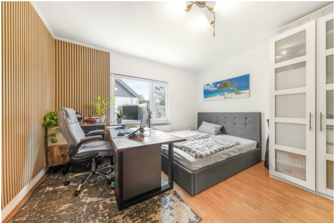
Home Office / Gäste KG