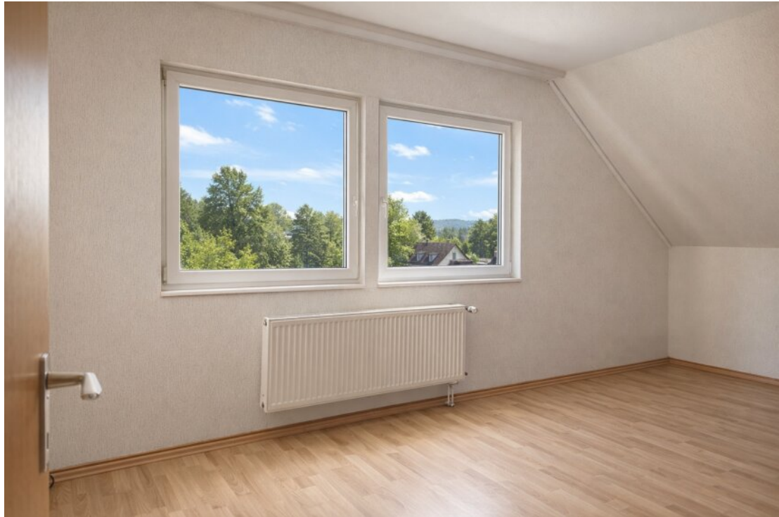
OG Schlafzimmer 2