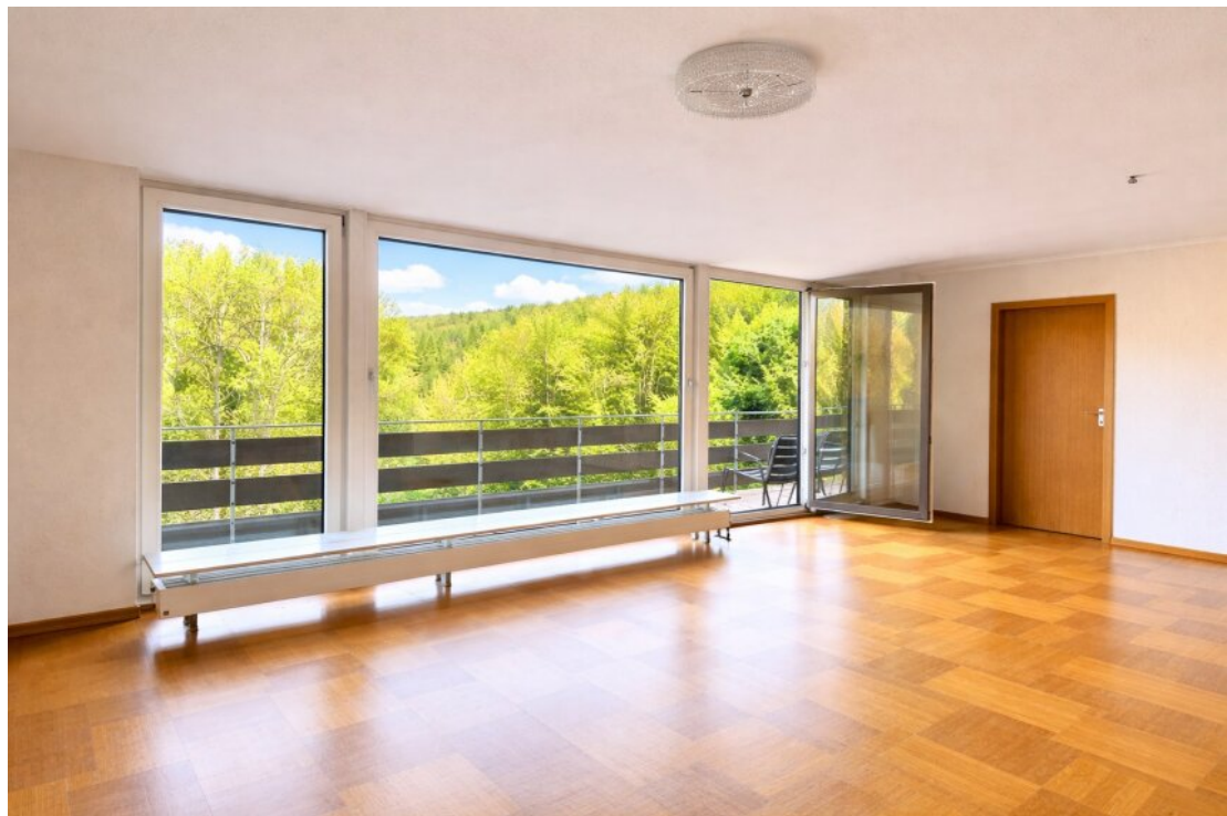
EG Wohnzimmer/ Zimmer Eingang