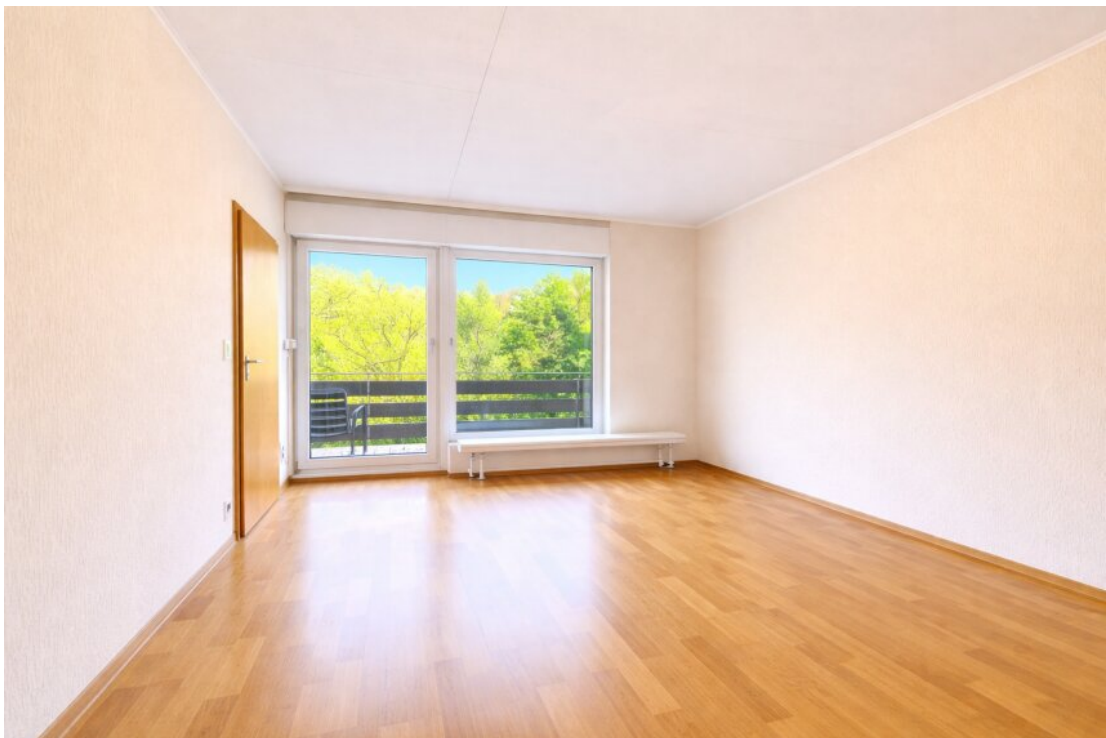
EG Zimmer neben Wohnzimmer