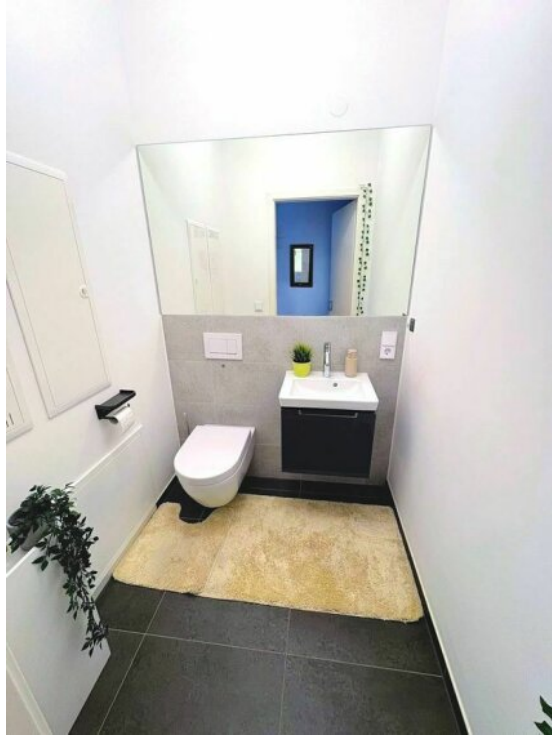
Gäste - WC