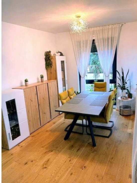
Essbereich in großem offenem Wohnbereich