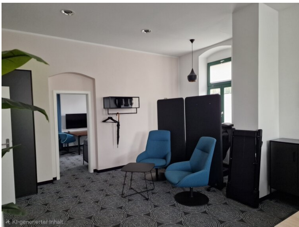
Büro - EG