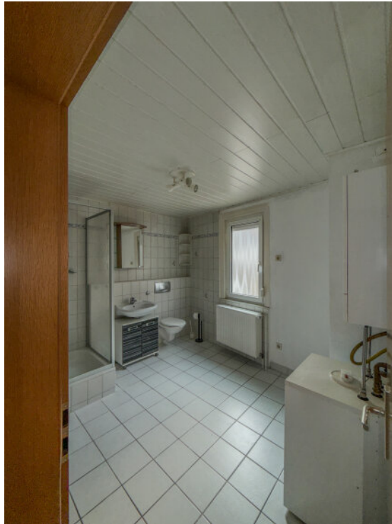
Badezimmer im Erdgeschoss