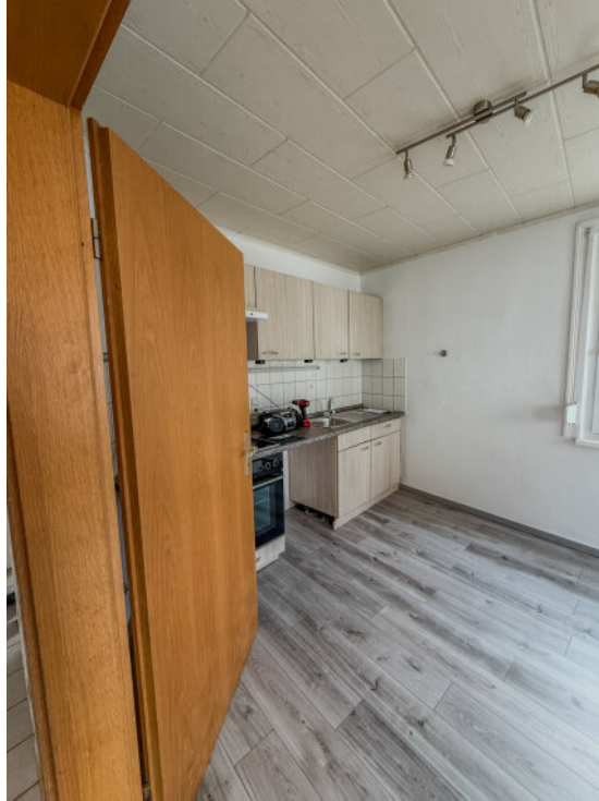
Küche im Erdgeschoss