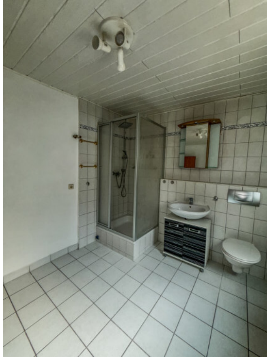
Bad im Erdgeschoss