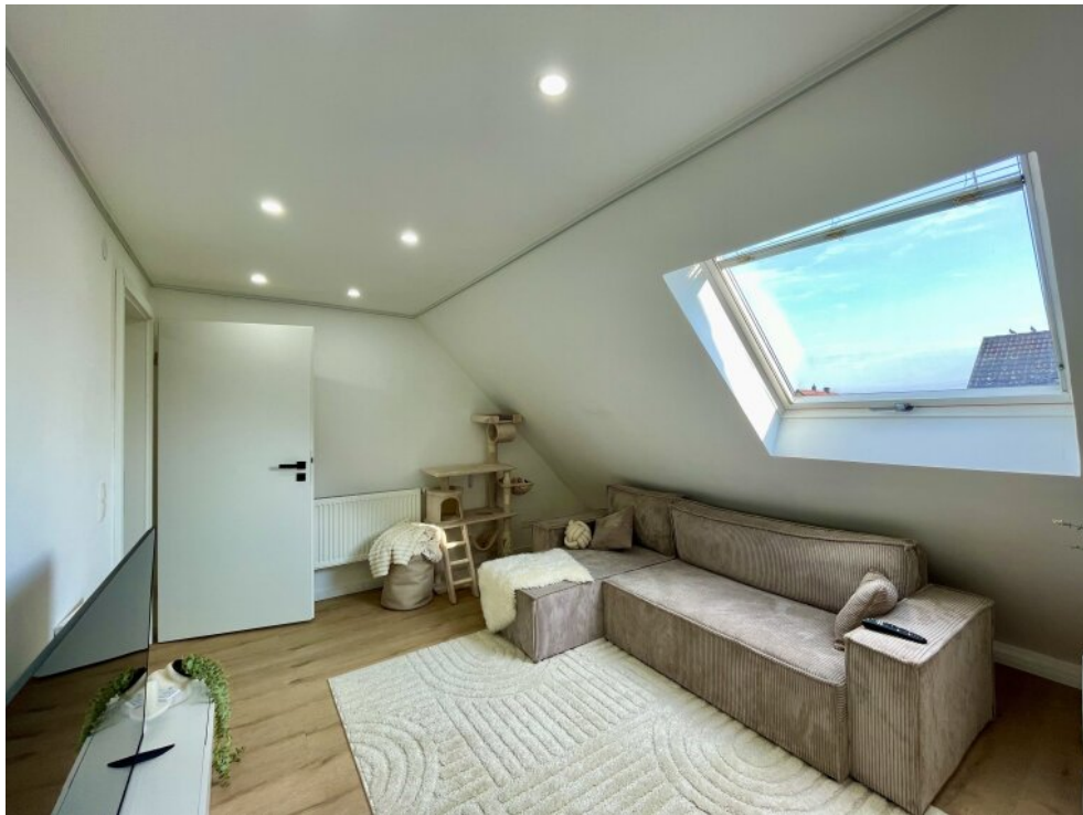
Wohnzimmer mit großem Fenster