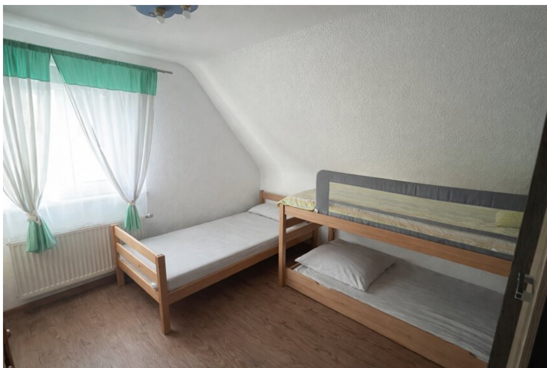
OG Kinderzimmer Nr. 3