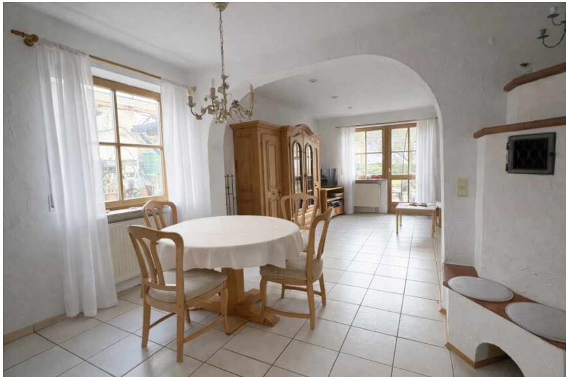
Esszimmer EG mit Kachelofen..