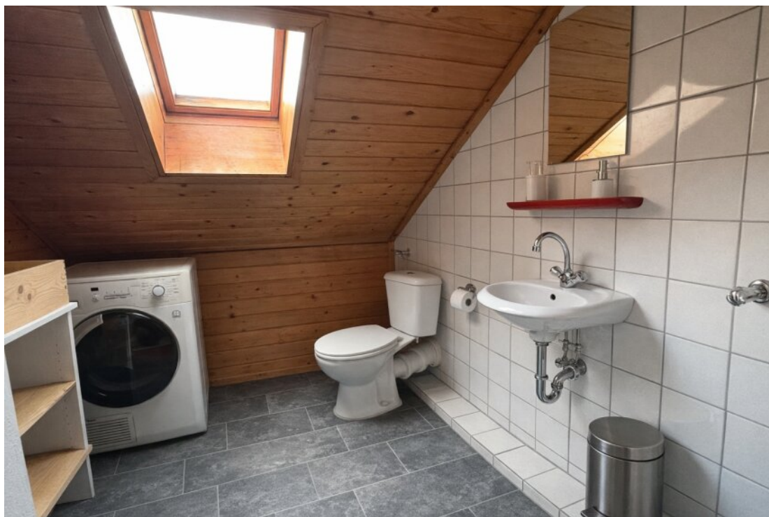
Gäste WC DG