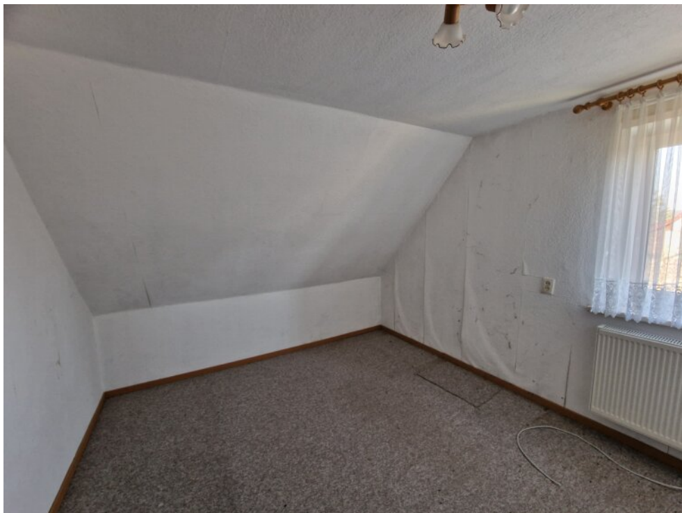
Zimmer 2 - OG