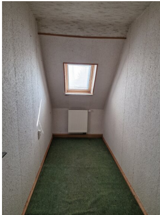
halbes Zimmer - OG