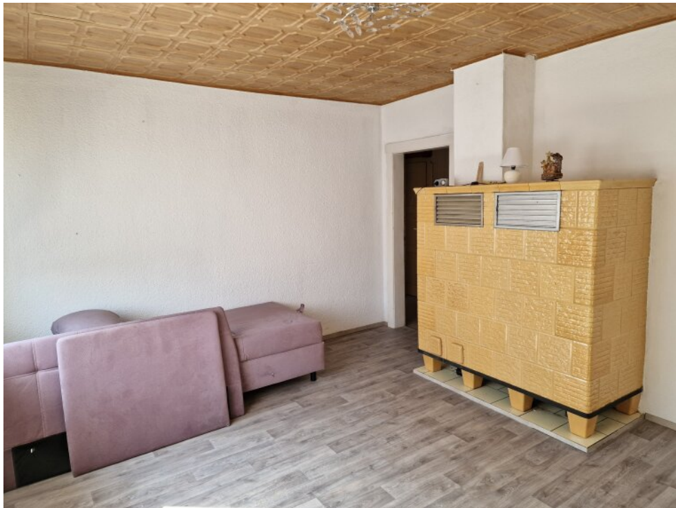
Zimmer 1 - EG