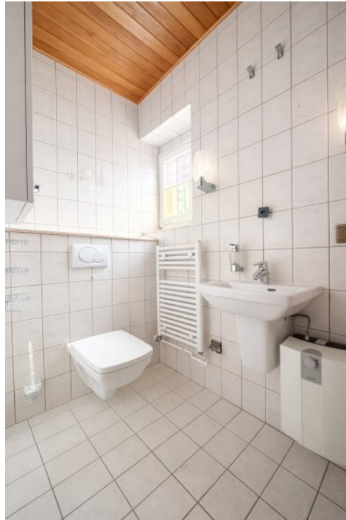
EG GWC im zweiten Flur