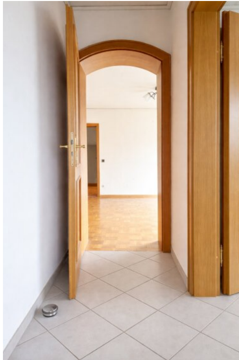
EG Eingang Wohnung