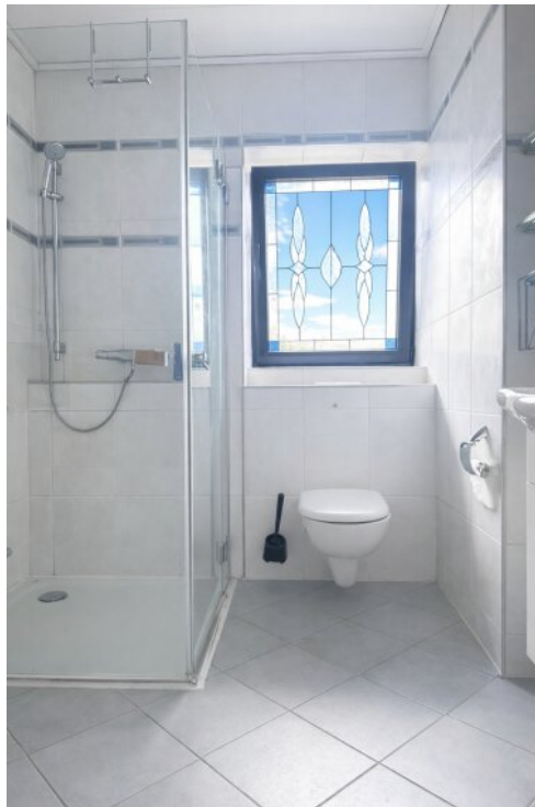
EG GWC mit Dusche