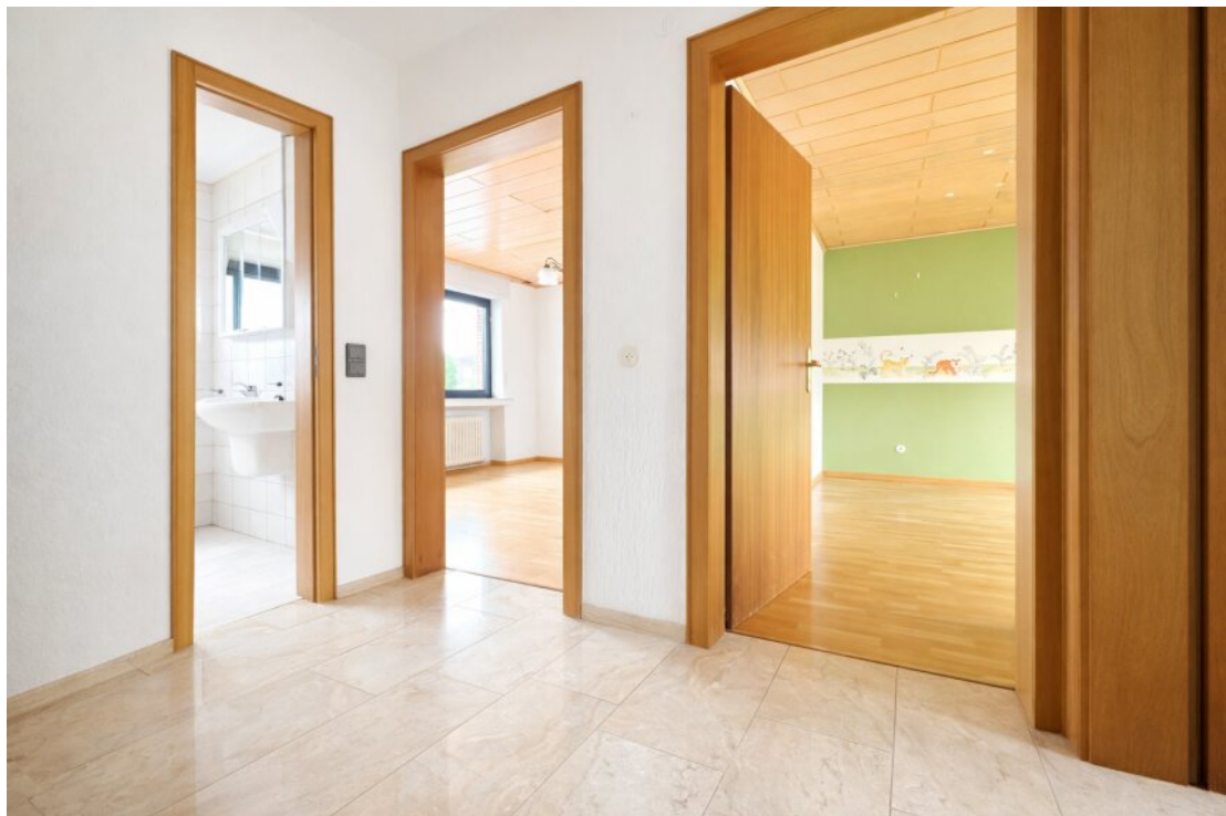
OG Flur Schlafbereiche mit Bad