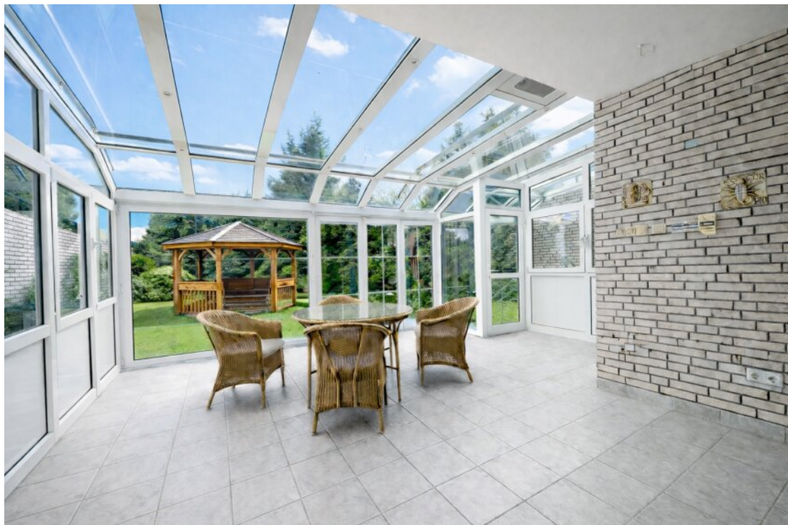
EG Wintergarten mit Gartenblick und Gartenzugang