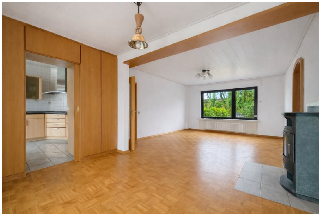
EG Wohnbereich mit Kamin