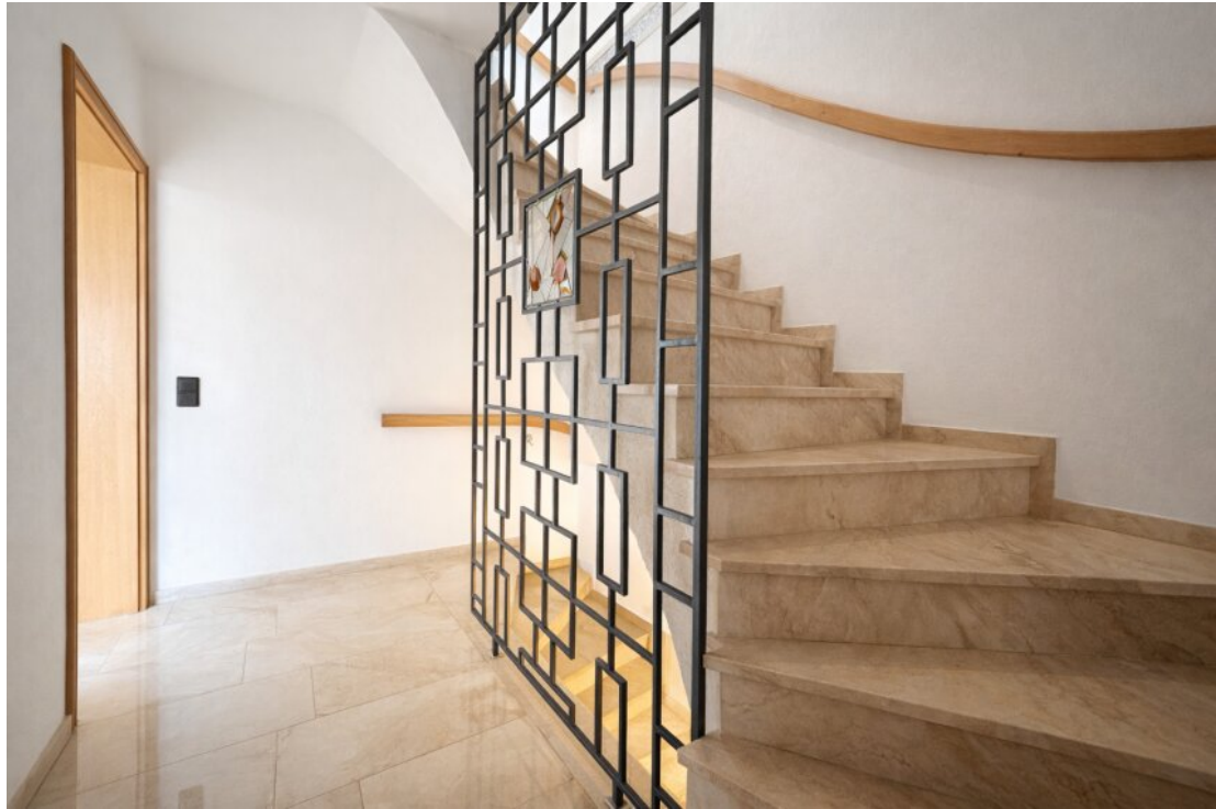
EG zweiter Flur