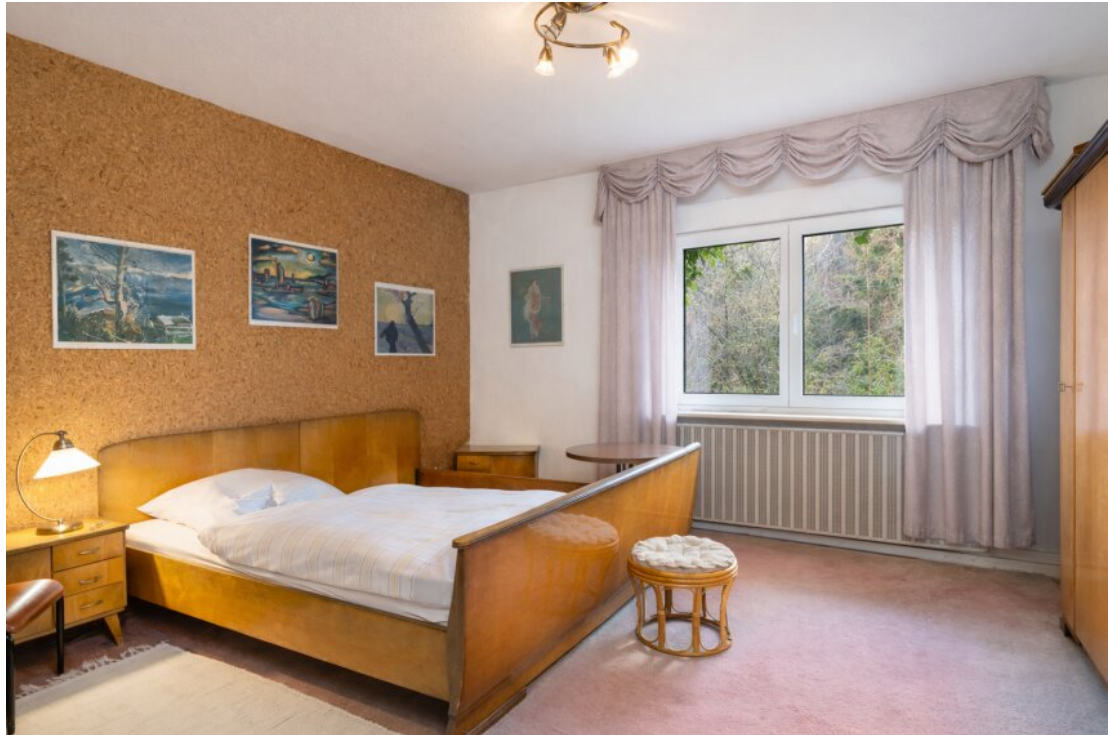
Helles Schlafzimmer mit Blick ins Grüne