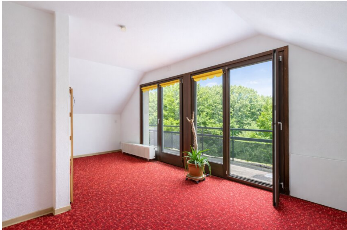
Studio DG Ausgang Loggia