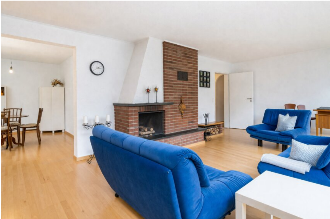
Helles, modernes Wohnzimmer mit Kamin