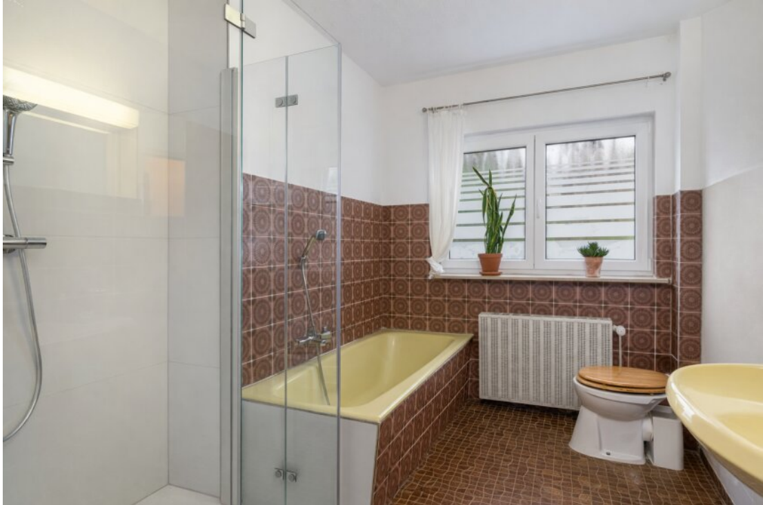
Badezimmer Wanne und Dusche EG