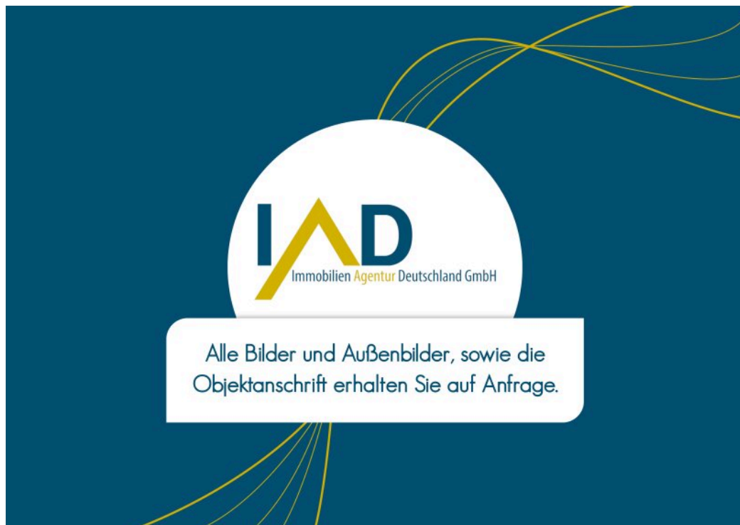
Bilder auf Anfrage