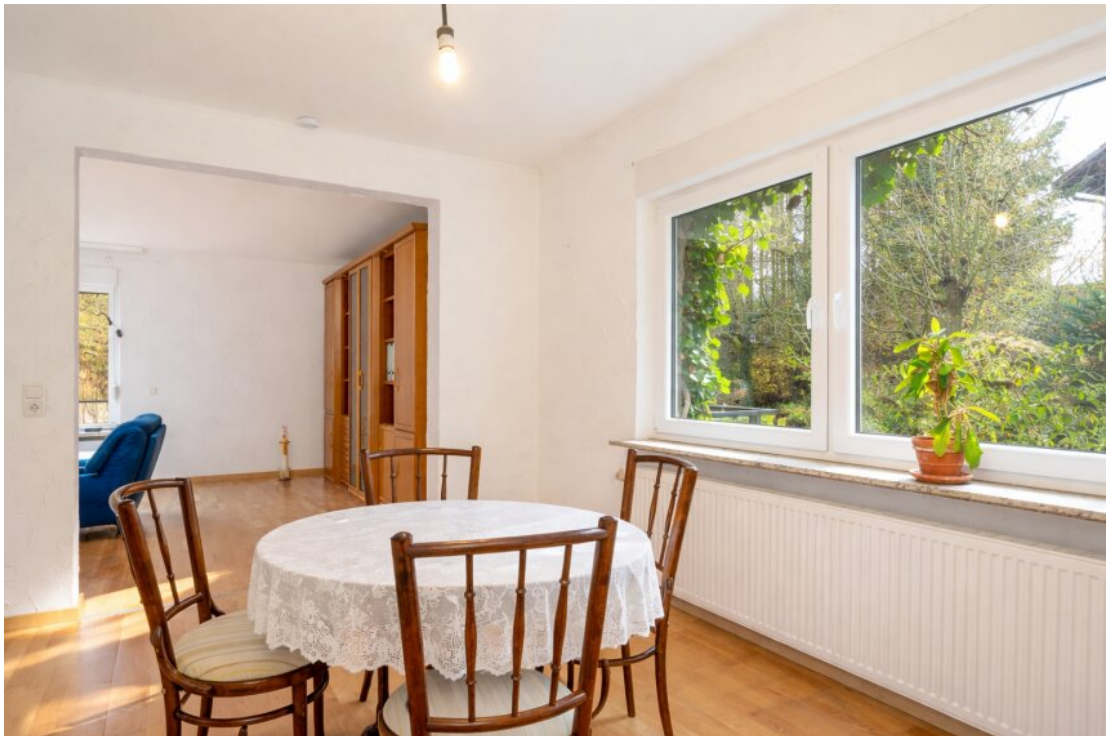
Helles Esszimmer EG