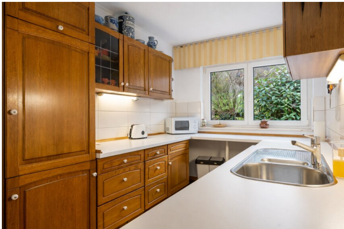
Küche mit Holzdetails EG