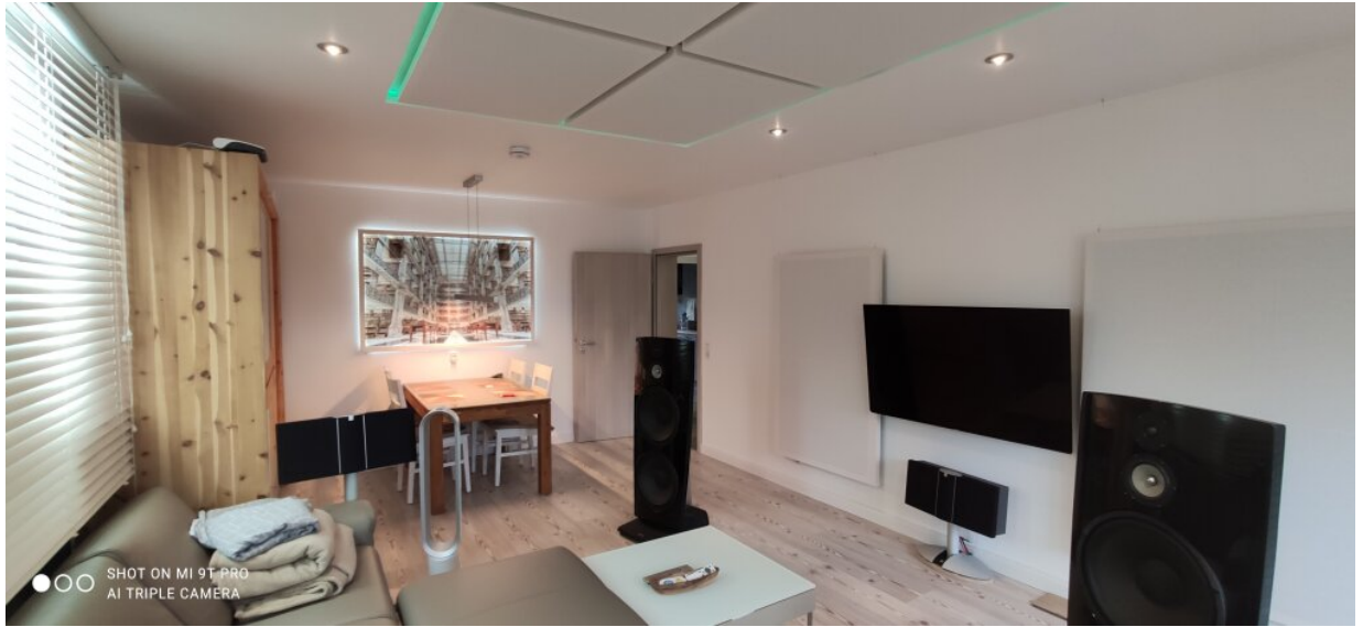
0_WZ-2 Akustik-Paneele Wand & Decke