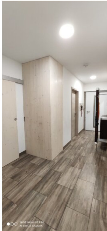
2_Flur 2 Echtholz-Tür & -Schuhschrank