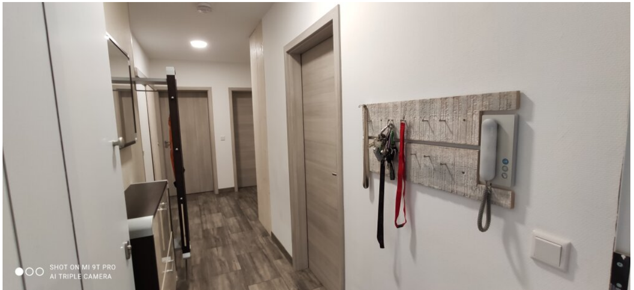
2_Flur 1 Hörmann (Glasscheibe foliert)