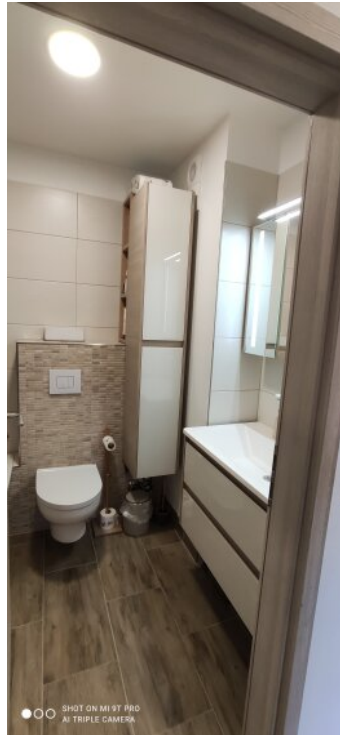
0_Bad 1 Naturstein Mosaik-Fliesen