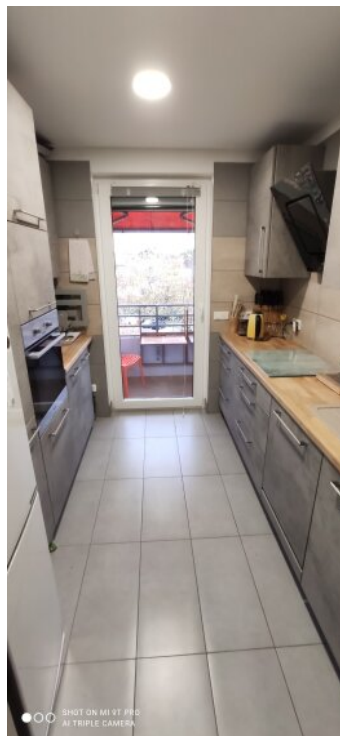
1_Küche 2 Furnier 3D Beton- Nachbildung