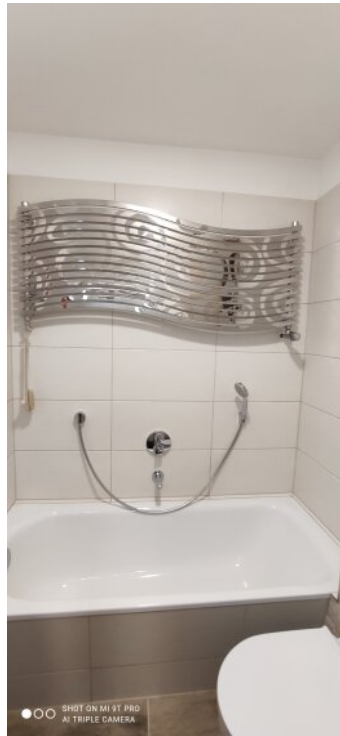
1_Bad 2 Design Heizkörper