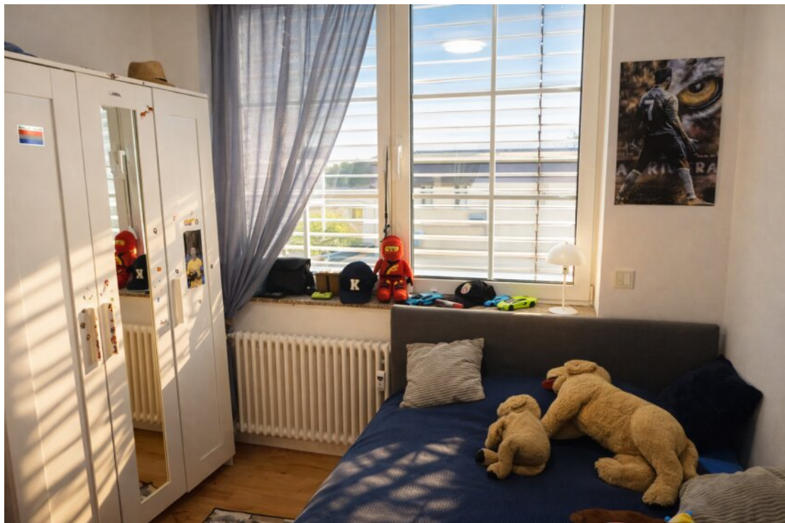
Kinderzimmer 1. OG