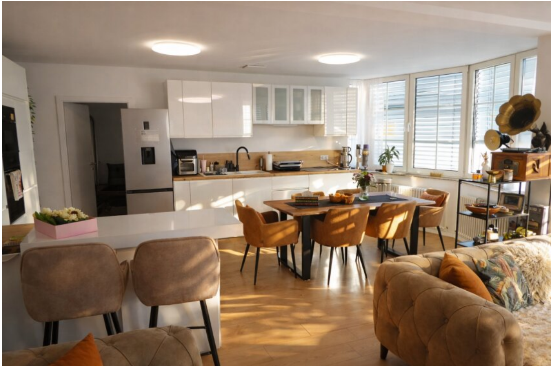
Essbereich und Küche 1. OG