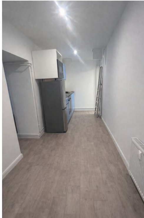
Flur und Küche