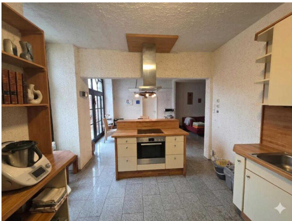
Küche & Wohnbereich