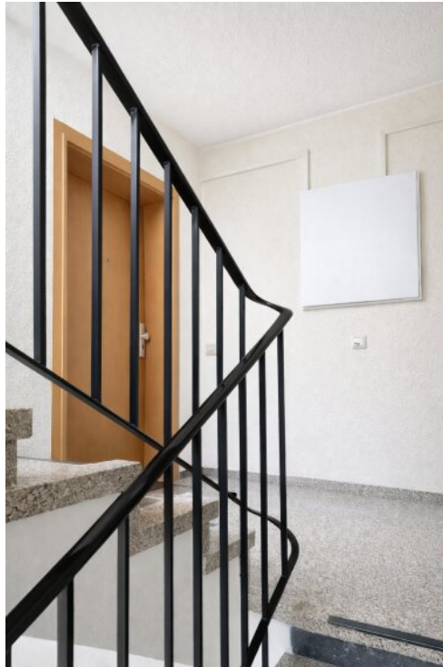
Hausflur zur Wohnung