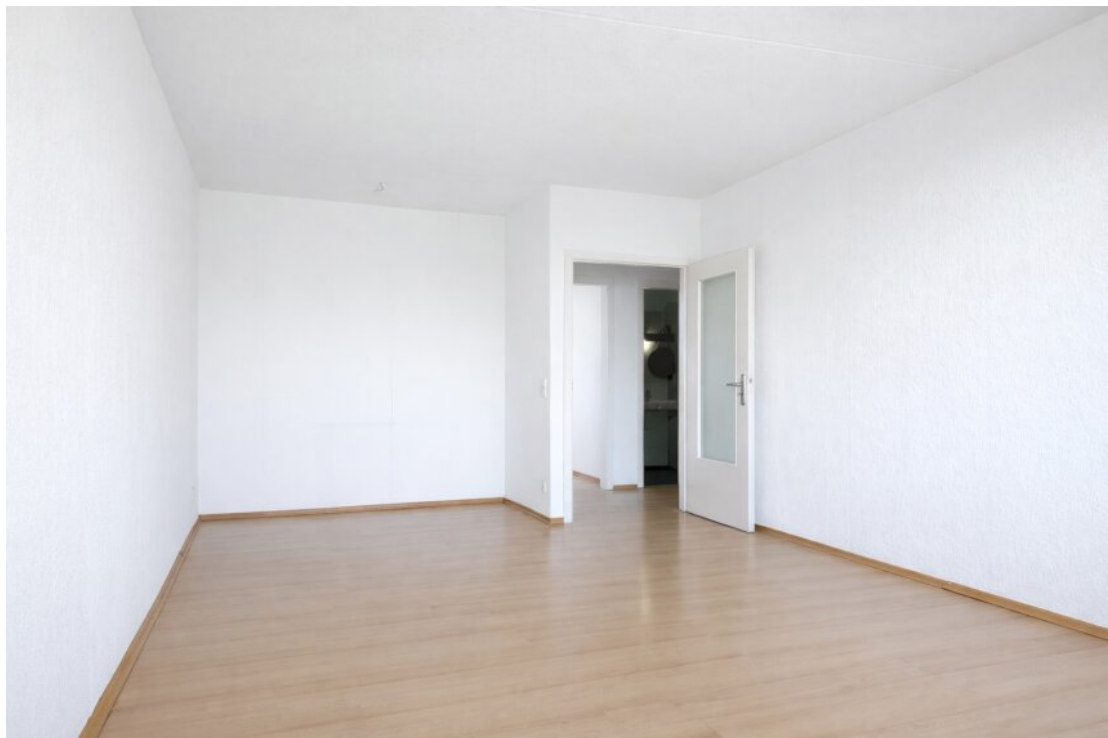
Wohnzimmer mit Essbereich