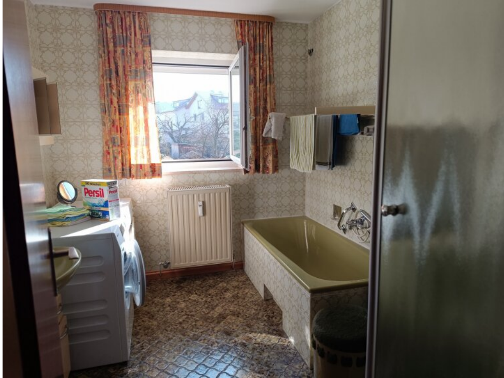
1. Stock Bad