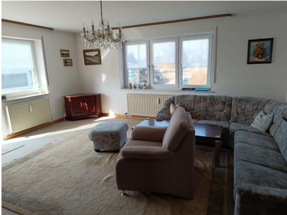
1. Stock Wohnzimmer