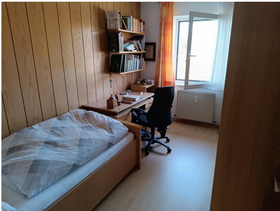
1. Stock Schlafzimmer Kinder