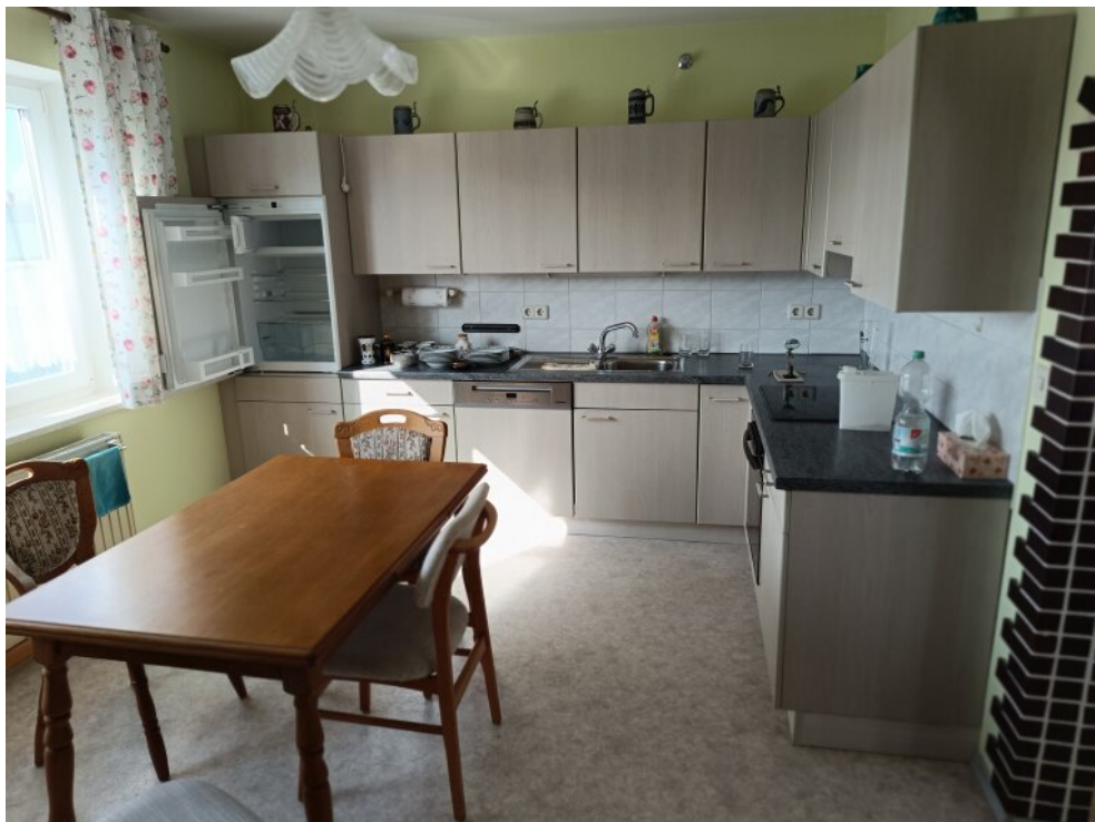
1. Stock Küche