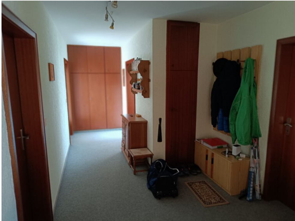
1. Stock Eingang Wohnung