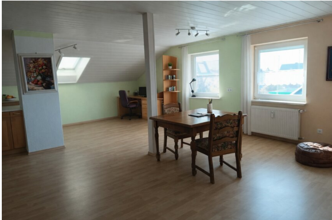
ChatGPT Image 9. März 2026, 17_02_45