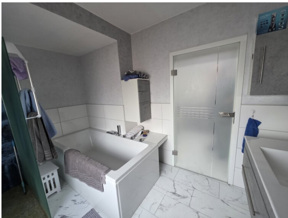
große Badewanne 1.OG