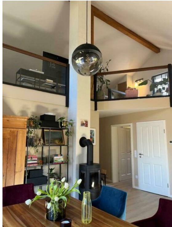
Essbereich Blick Empore