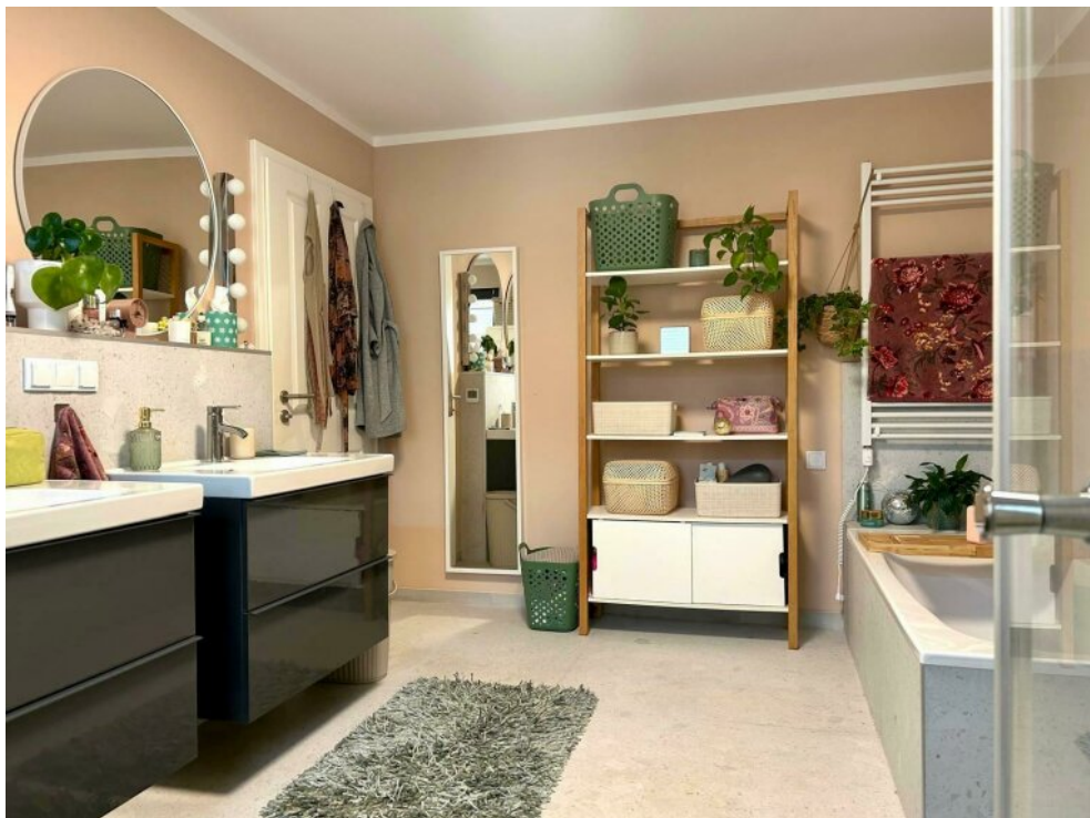
Tageslichtbad Wanne Dusche