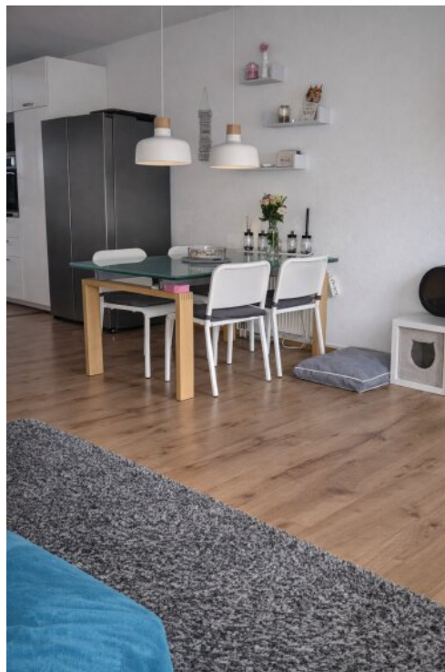
Helles Wohn- und Esszimmer