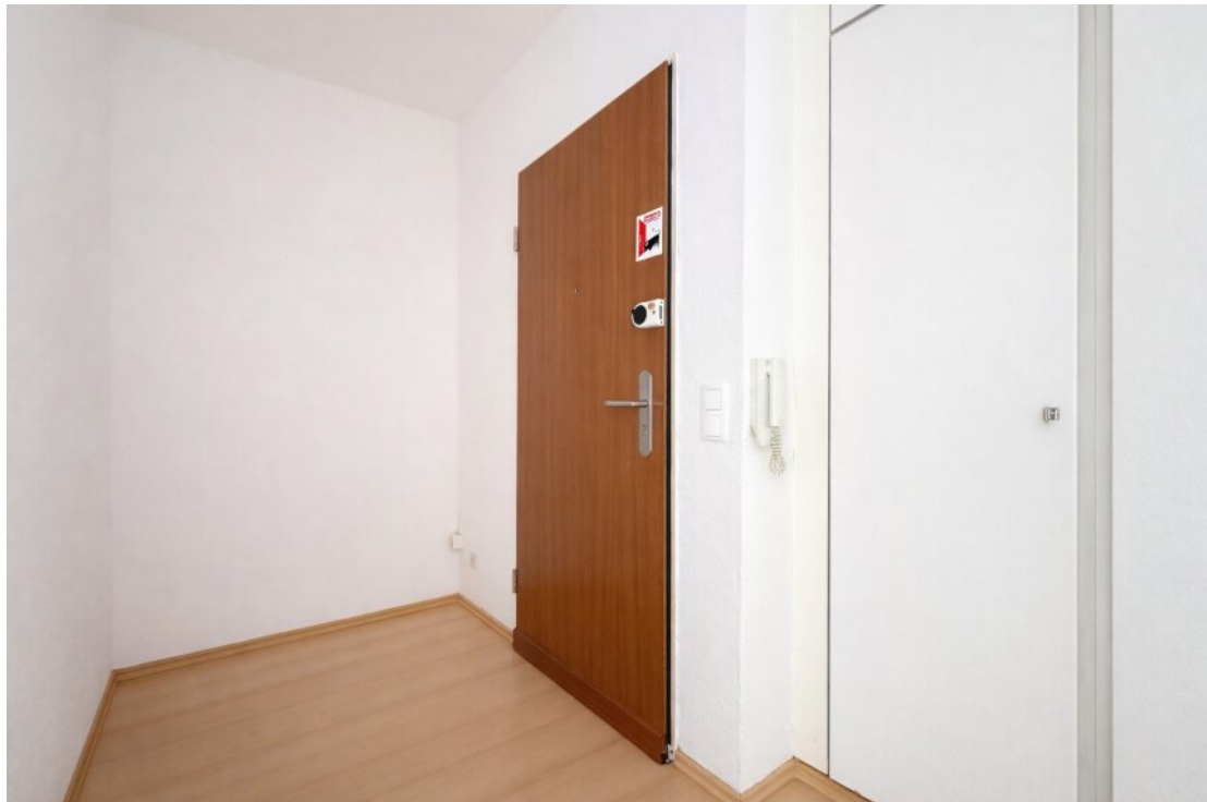
Eingangsbereich mit Garderobe