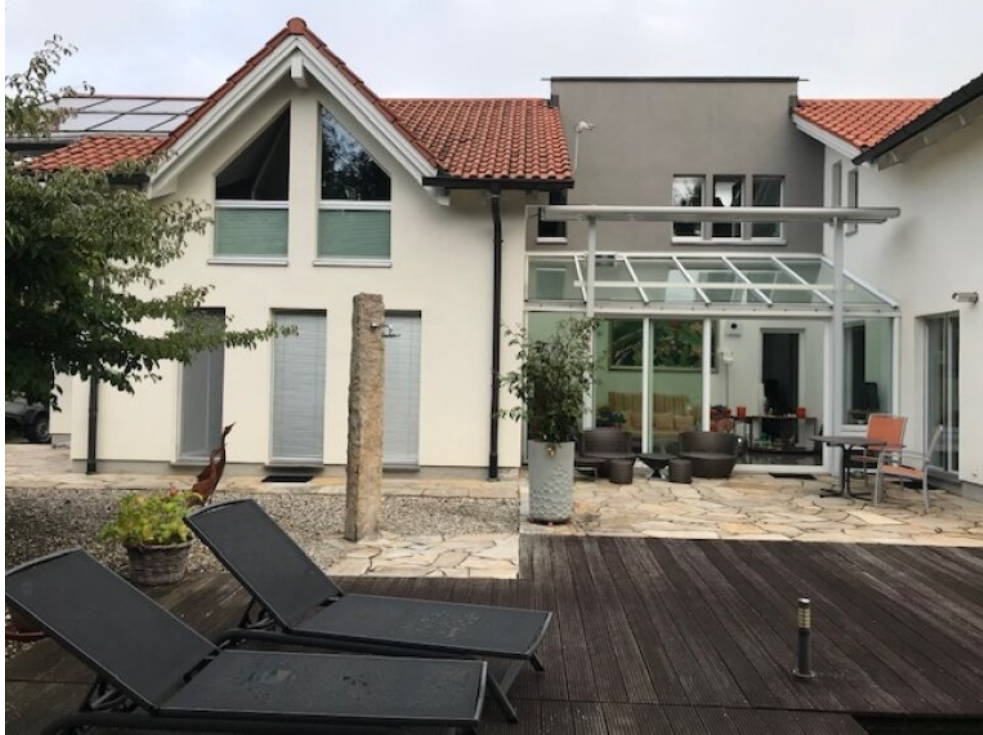
Blick zu beiden Häusern