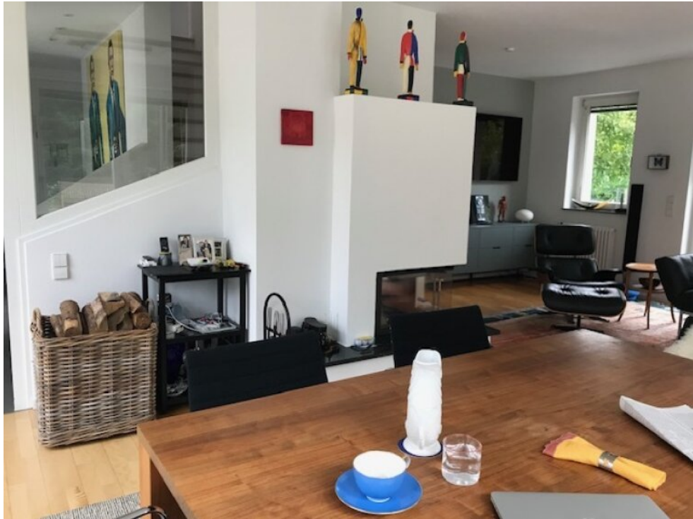
Blick zum Kamin