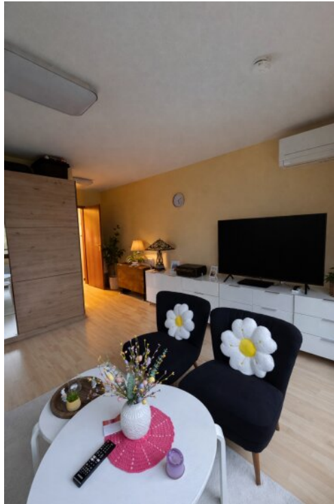
Wohnzimmer Blick zu Flur