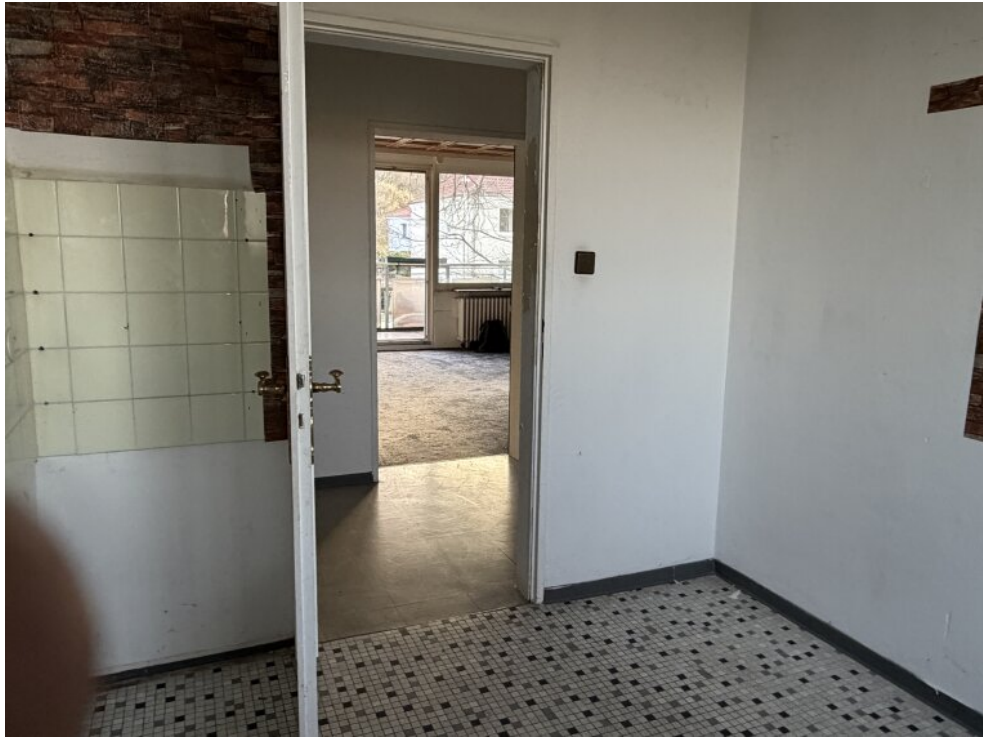
Blick von Küche in Wohnzimmer