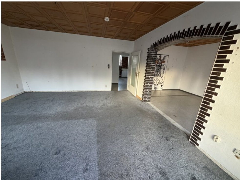
Blick Richtung Norden