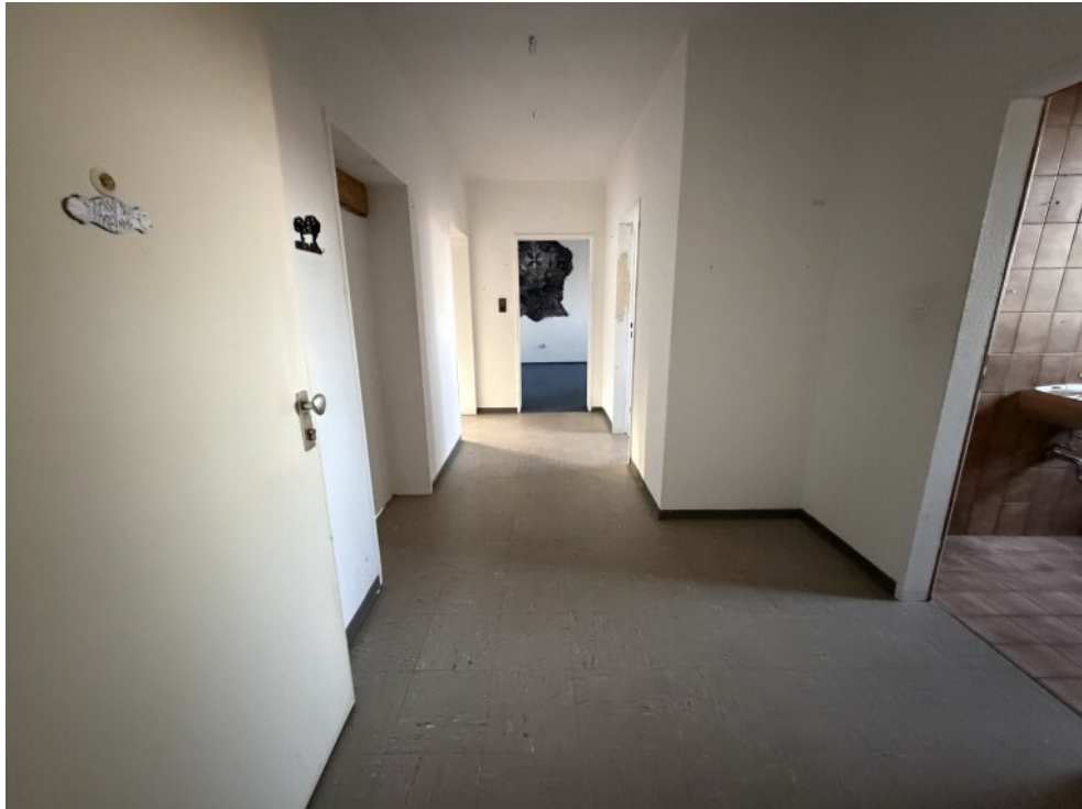
Blick in die Wohnung