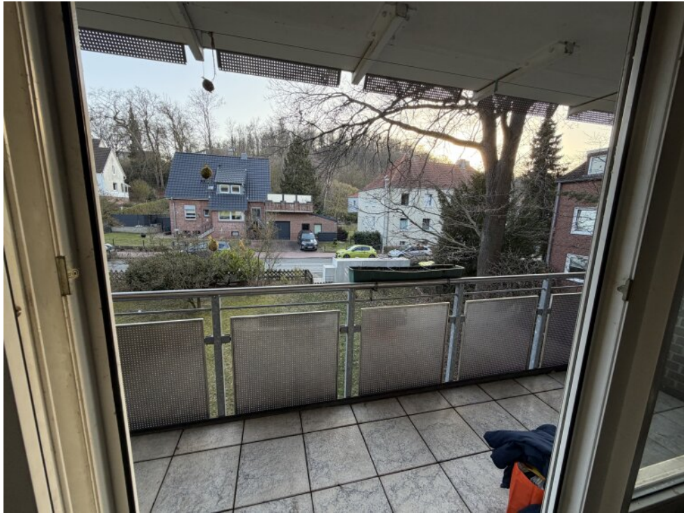
Schiebelement zum Balkon