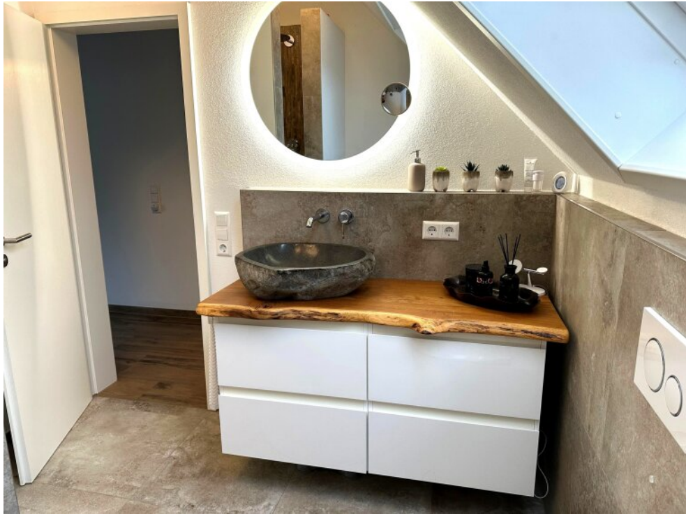
Badezimmer 2 (oben)