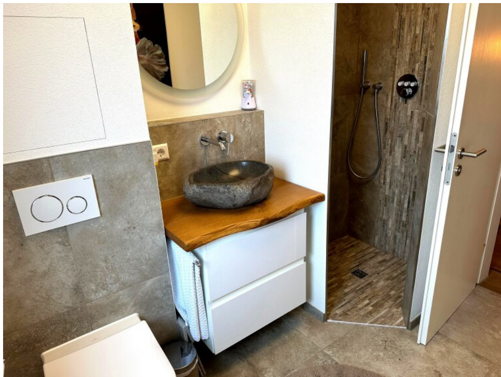
Badezimmer 1 (unten)