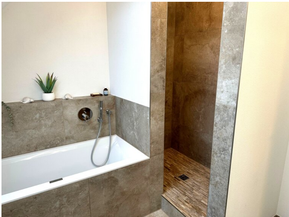
Badezimmer 2 (oben)