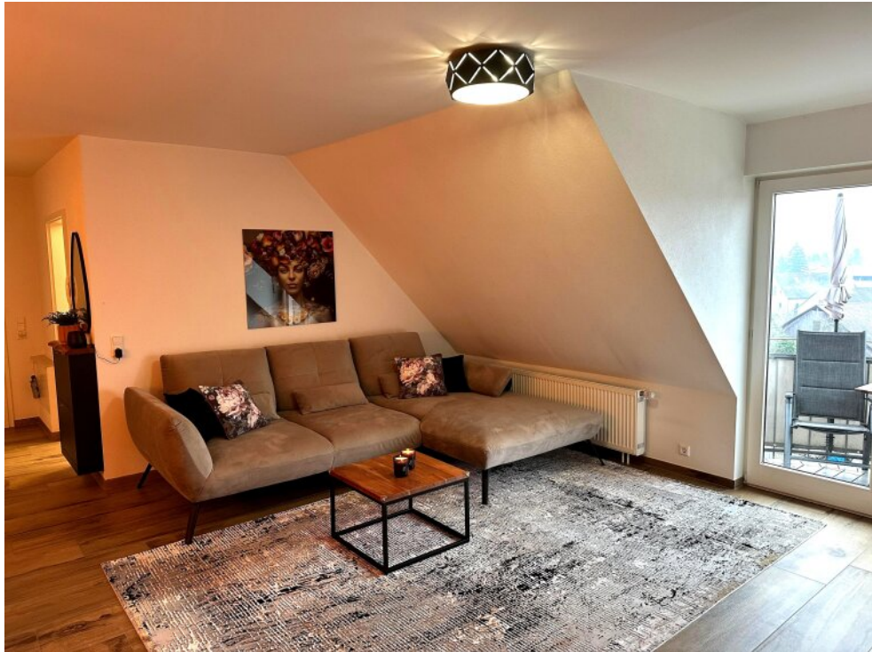
Wohn-/Essbereich - Balkon