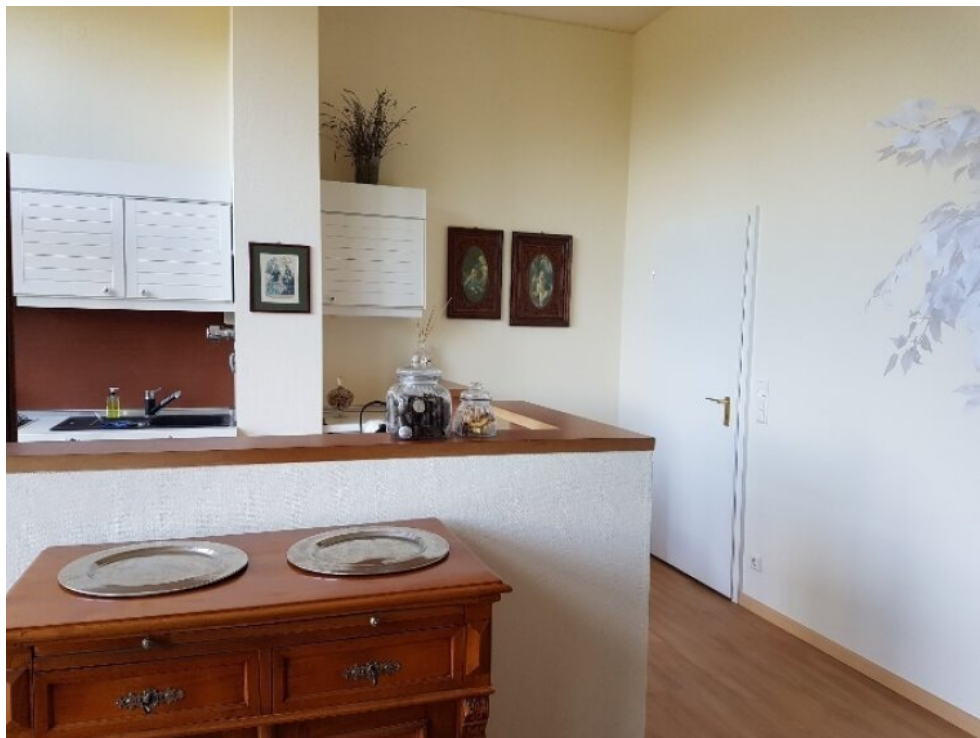
Blick aus dem Ess-Wohnbereich zur Küche