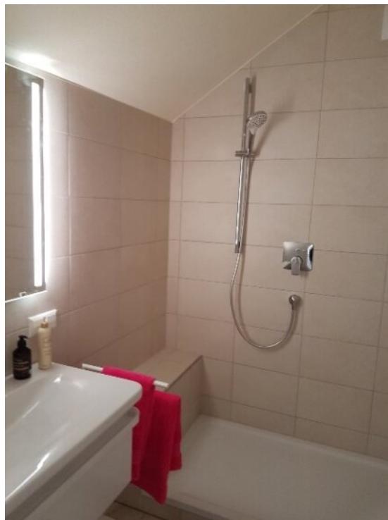
Bad mit Dusche-Glasabtrennung