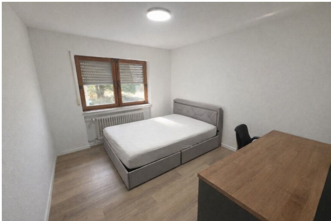
EG Schlafen Nr. 2