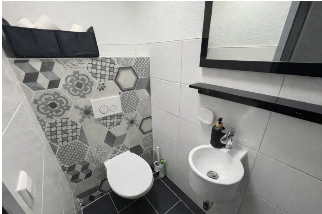
EG Gäste WC