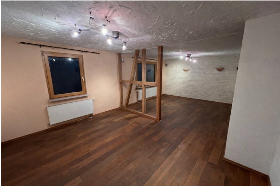
Wohn- & Esszimmer