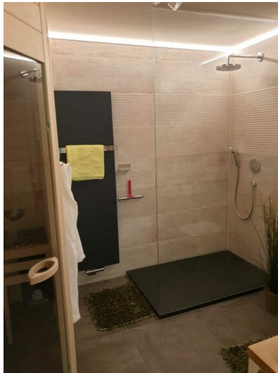
Bad 2 mit Sauna