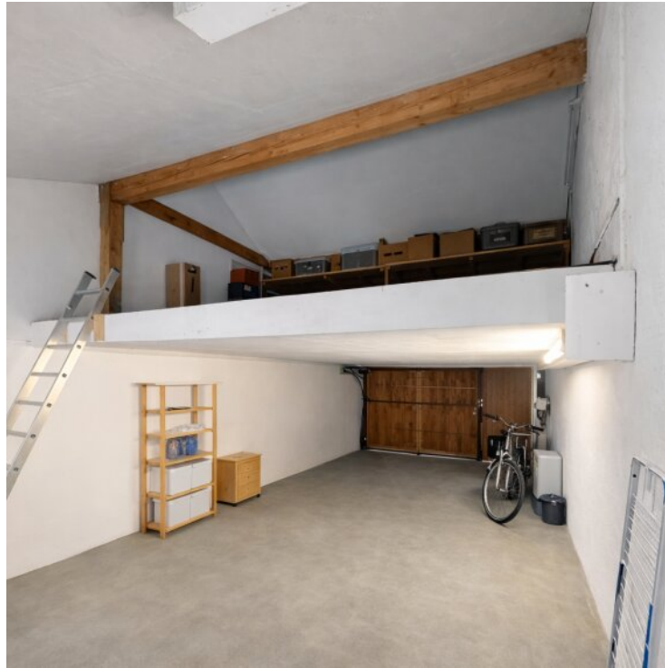
Garage mit Stauraum