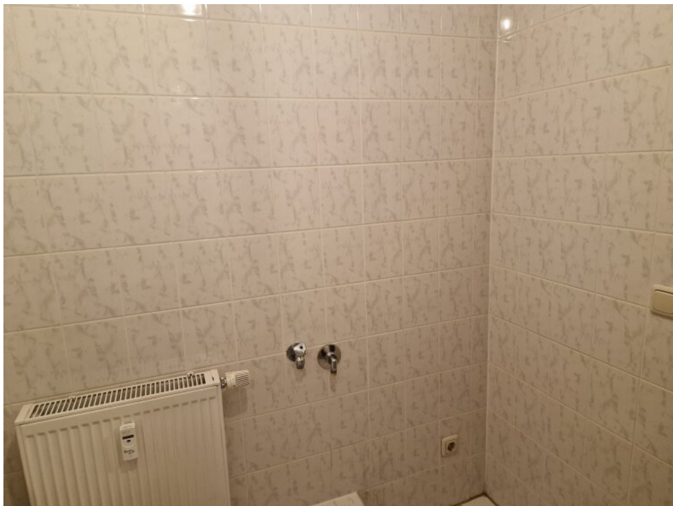
Waschmaschinenanschluss im Bad