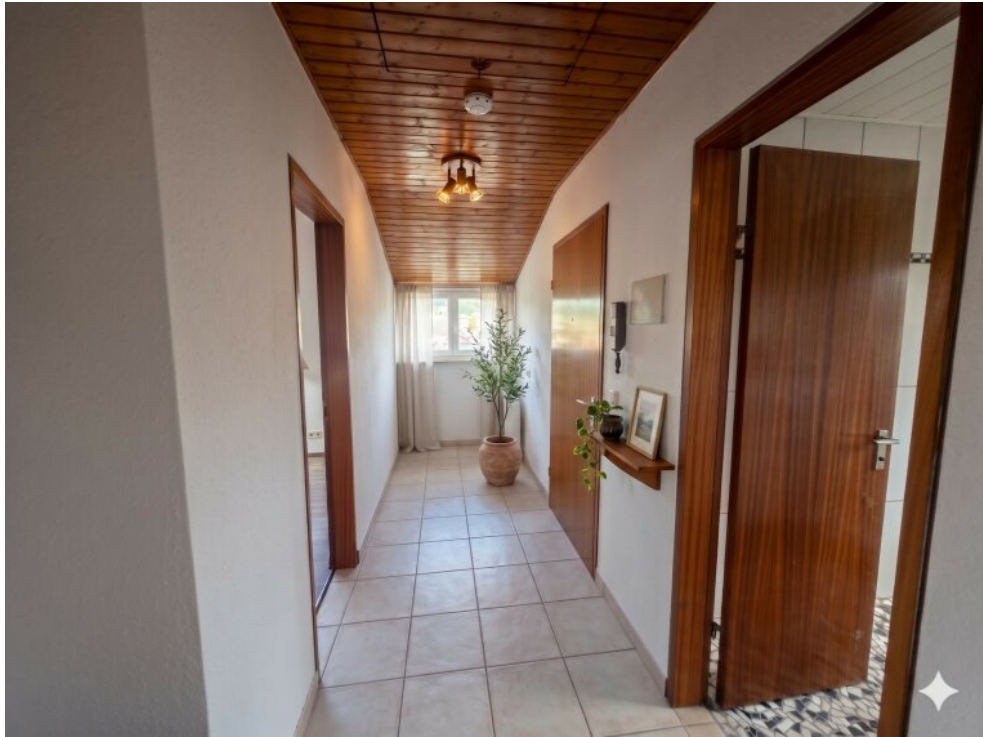
Flur - Virtuell eingerichtet