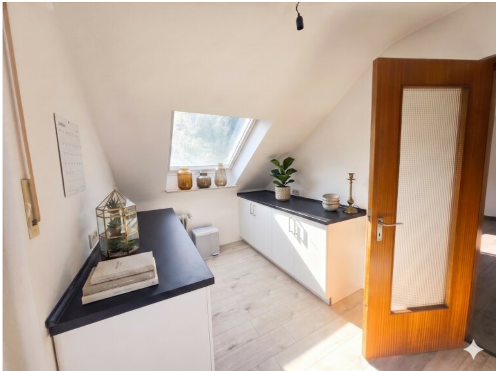
Küche - Virtuell eingerichtet