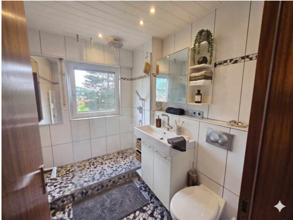
Bad - Virtuell eingerichtet