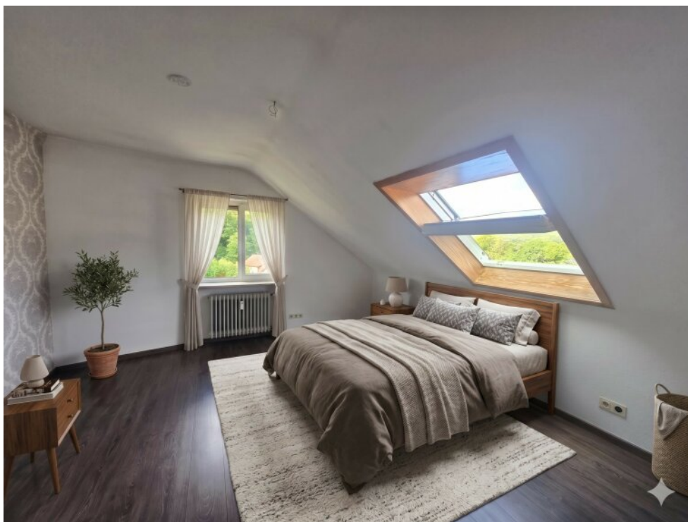
Schlafzimmer - Virtuell eingerichtet