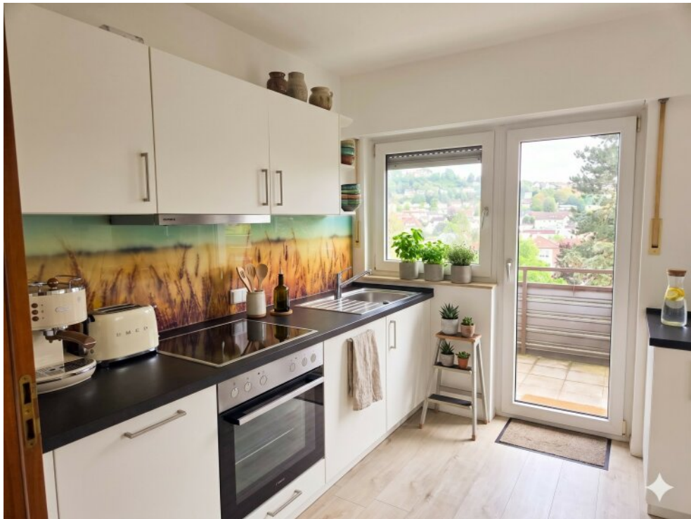
Küche - Virtuell eingerichtet